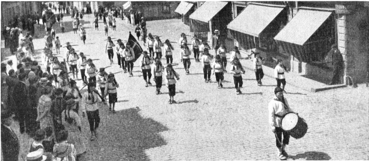
Aufmarsch der jungen Armbrustschützen.

Buben der obern Schulklassen durchgeführt, im Dorf in einem Schießstand, auf den Vierteln im Feld. Um 1915 wurde das Armbrustschiessen im Dorf aus schiesstechnischen Gründen leider aufgegeben und durch das Flobertschiessen ersetzt. Man bediente sich der Bollinger-Armbrust und schwerer Stecher, die man von einheimischen Armbrustmachern bezog. Die Armbrüste wurden vor dem Anschlagen mit Yhenbögen gespannt. In der Woche vor der Kirchweih durften die Buben sogenannten Grümpel (Naturalgaben) betteln. Sie erschienen zu zweien, einer mit der Armbrust, der andere mit dem Bügel auf der Schulter, hemdärmelig, einen Blumenstrauss auf dem Filzhut und sagten Schützensprüchelein folgenden Inhalts auf: «I bin en arme Schützechnab und bitte um ne Ehregab», oder: «Wir möchten den Herrn und die Frau angesprochen haben, dass sie uns armen Bürgerschützenknaben etwas zum Verschiessen gaben».