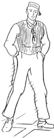
Tanzschenk um 1880 von M. Gyr.

14. Der Tanzschenk. An der Kirchweih spielte auf der Tanzdiele der Gasthäuser (früher auf dem Rathaus) bis in die 80er Jahre der Tanzschenk eine besondere