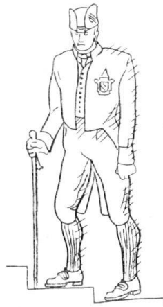
Der alte Läufer «in guter Form». Skizze v. M. Gyr

Man versteht und schätzt es, dass die Behörden Unfug verhindern, wenn sie im Amtseifer nur nicht alles schwarz sehen und infolgedessen das Kind gleich mit dem Bad ausschütten. Also, ganz allgemein gesprochen, nicht zu oft das Böse verneinen, sondern öfter das Gute bejahren . Ich wollte, es hiesse bald, das sei unser typische Ratsherrenbrauch des 20. Jahrhunderts.