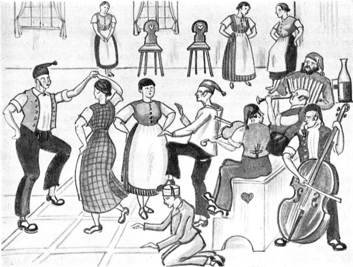
Gäuerlen auf der Tanzdiele um 1880. Skizziert von M. Gyr, gezeichnet von A. Bader.

sehr alt. Er kann deutschen Ursprungs sein. Der Name «Alemander» greift meines Erachtens auf die Zeit der Invasion französischer Truppen um 1798 zurück. Die französischen Soldaten sahen, wie die Deutschschweizer tanzten und sagten zueinander: «Ils dansent à l'allemande». Darauf bekam eine Abart des Gäuerlers seinen Namen (man vergleiche quelle heure est-il? und Gelleretli (Uhr), point d'honneur und Puntenöri , aller se coucher und ins Guschi gehen usw.). Uebrigens deckten sich die Hauptmerkmale aller Gäuerlertänze mehr oder weniger. Man legte ihnen, je nach der Landesgegend, einen Ortsnamen zu. So nannte man ihn im Muottatal den Hüritaler . Um den Tanz zu beleben, nahm der Tanzschenk gelegentlich auch ein Tanzschenkermaidli , das am Täfer lehnte, an der Hand und führte es einem tanzlustigen Burschen zu, der ohne Mädchenbegleitung auf der Tanzdiele erschienen war. Diese Uebung ist im Ybrig und im Alptal jetzt noch gebräuchlich. Ihr verdankt mancher junger Bursche, dass er tanzen gelernt hat.