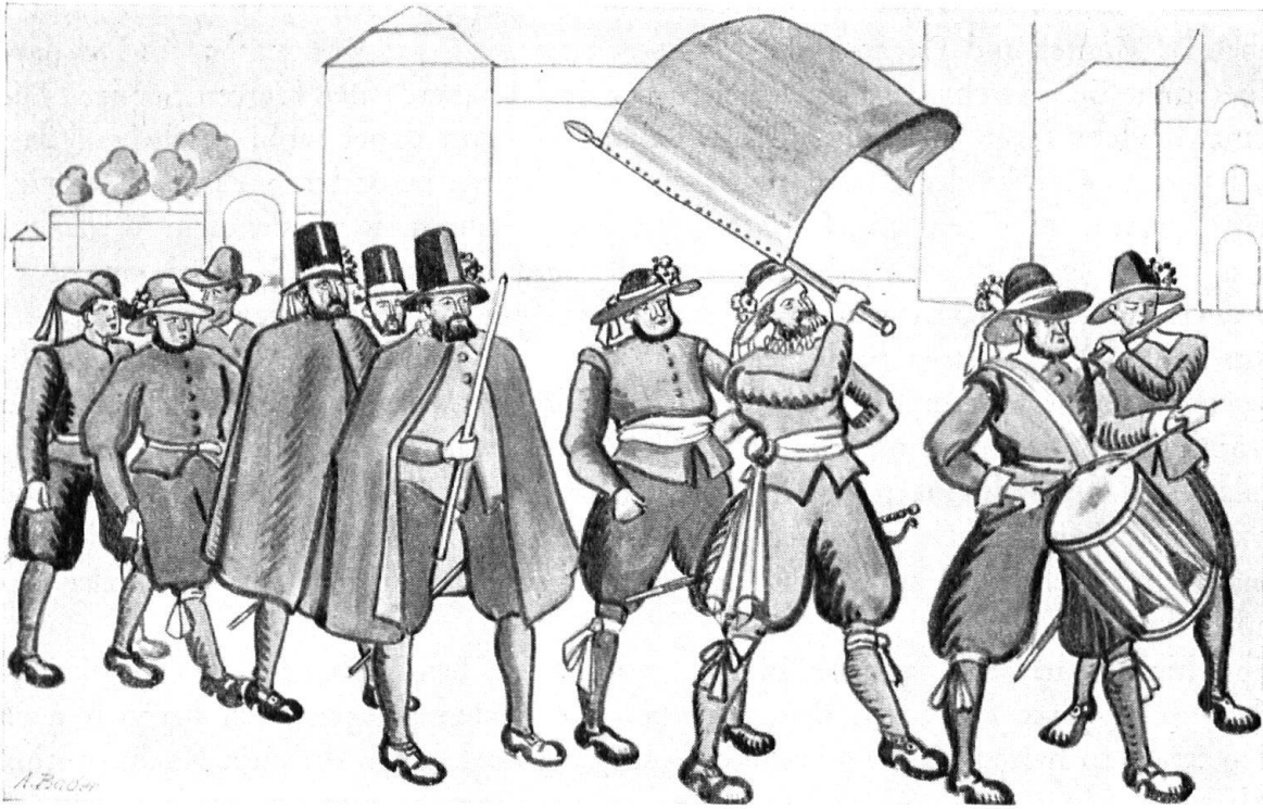
Umzug der Sennengesellschaft von 1700. Skizziert von M. Gyr, gezeichnet von A. Bader.

wil stammende Stiftskonventual P. Josef Dietrich im Jahre 1682 (nach M. Ochsner in «Feierstunden»):