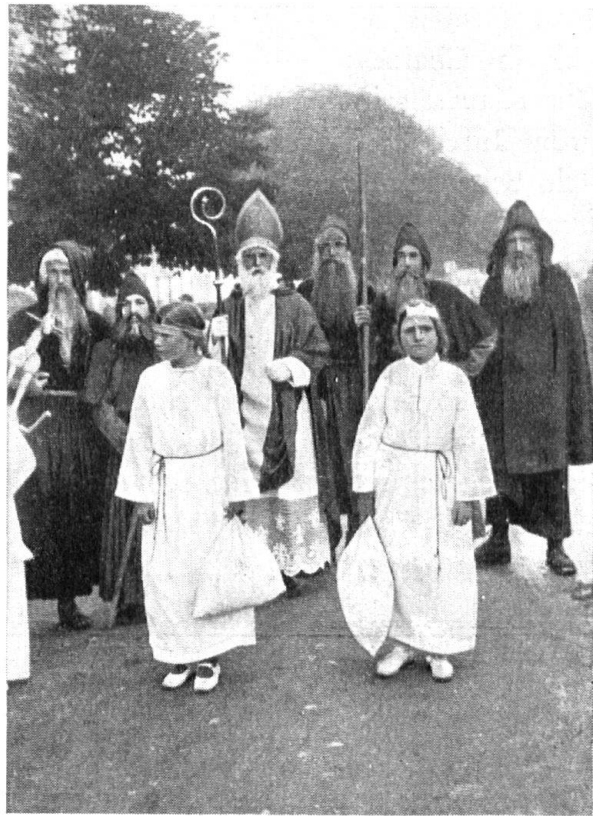
Der heilige Nikolaus mit Engelein und Waldbrüdern.

18. Klausenlaufen und Infelntragen. Es beginnt in der Zeit um das Fest des hl. Nikolaus. Der Samichlaus im langen, weissen FaltenGewand mit der grossen kerzenbeleuchteten Infula auf dem Kopfe ist die Hauptperson. Um ihn reihen sich zwei oder drei wildbärtige Waldbrüder, die von einer schwarzen Kutte mit Kapuze umhüllt