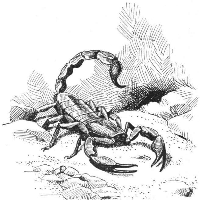
Abb. 20. Skorpion. Federzeichnung von A. Portmann, Illustration aus Zschokke's „Tierwelt des Kantons Tessin“. — Fig. 20. Le scorpion. Dessin à la plume, illustrant la publication du professeur Zschokke sur le règne animal dans le Tessin.

Eine prächtige Gabe ist es, die der bekannte Zoologe hier den vielen Freunden des Tessin und den Naturliebhabern überhaupt bietet. Selbstverständlich hält das Buch des Basler Universitätsprofessors allen wissenschaftlichen Anforderungen stand; es wendet sich aber an ein grösseres Publikum und berichtet in einer gepflegten Sprache, der man die Freude des Verfassers an dem schönen Sonnenland anmerkt, von den vielen Merkwürdigkeiten der tessinischen Fauna. Sie ist sehr reich, weil hier zwei Zonen zusammenstossen, indem das kalte Klima der Alpen an die Wärme Italiens grenzt. Professor Zschokke wählt aber geschickt das aus, was besonders interessant oder auffallend ist, und belebt überdies seinen Text durch ansprechende Federzeichnungen von A. Portmann. So mancher Wanderer, der an den Südfuss der Alpen kommt, möchte gerne das Eigenartige des Gebietes, die Vorposten des Mittelmeerklimas kennen