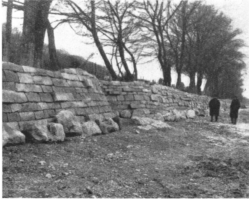
Abb. 19. Neuer Uferschutz am Bodensee, südlich von Moosburg. 1928. Fig. 19. Nouvelle manière de protéger les grèves du lac de Constance. Environs de Moosburg.

Naturschutz am Bodensee. Letzten Jahres hat die «Jabusch» (Internationale Arbeitsgemeinschaft für den Bodensee-Uferschutz, ihre Werbe-Versammlung in Lindau abgehalten. Sie erhält nunmehr von allen Uferstaaten eine Subvention, auch von den schweizerischen Kantonen St. Gallen und Thurgau. Die Angelegenheit wird jenseits des Sees als so wichtig betrachtet, dass an den Versammlungen jeweils Vertreter der Landesregierungen aus München, Stuttgart und Karlsruhe teilnehmen. Hauptgegenstand der Verhandlungen war diesmal der Einfluss der kommenden Bodenseeregulierung auf die Pflanzen- und Tierwelt des Schwäbischen Meeres. Dabei stellte man mit Befriedigung fest, dass die Wirkung vorwiegend günstig sein wird, indem zwar die höchsten Wasserstände gesenkt werden, die tiefsten aber unverändert bleiben sollen. Daraus lässt sich ein Vorstoss der Pflanzenwelt nach dem Wasser zu erwarten. Für die Fischerei wird die Senkung der Hochwasser geradezu von Vorteil sein, da die Jungbrut alsdann nicht mehr in überschwemmte Wiesen eindringen kann, wo sie bisher massenhaft zu Grunde ging.