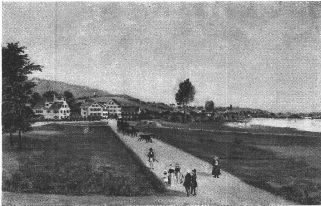
Abb. 15. Wollishofen, Gegend am See um 1850, nach Gemälde von K. Burkhart. — Fig. 15. Wollishofen et les environs du lac, vers 1850, d'après un tableau de K. Burkhart.

Gerade über Tal und Hügel, über Fluss und Acker, über Obstbaumgärten und durch eine herausgehauene Waldschneise unsere Heimat lieblos durchsaust, empfinden wir doch einen leisen Stich im Herzen ob diesem Aus-