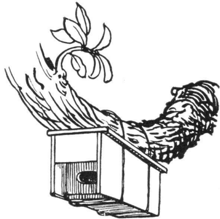
Abb. 12. Guter Nistkasten. (Abb. 11 und 12 sind Illustrationsproben aus: Ramseyer, Unsere gefiederten Freunde). — Fig. 12. Nid artificiel bien compris. (Les gravures 11 et 12 sont extraites de l'ouvrage de Ramseyer: «Unsere gefiederten Freunde».)

die noch die natürliche Baumrinde tragen und mit dem runden Flugloch und der flaschenförmigen senkrechten Höhle genau einem Spechtloch entsprechen. Diese Kästen, welche sozusagen die Tradition im Vogelreich darstellen, sind heute allgemein verbreitet. Aber bekanntlich gibt es auch am schönsten altertümlichen Bauernhaus Dinge, die man heute praktischer gestalten würde. Ramseyer glaubt, dass die Vögel beim Eintritt durch das runde Flugloch die Flügel an den Leib pressen müssen und nachher in der senkrechten Höhle auf ihre Jungen hinabfallen. Deshalb gibt er seinem Nistkästchen, das aus Brettern besteht, ein querovalen Flugloch und eine wagrechte Höhlung. Ich glaube nicht, dass die Vögel diese Erleichterung schätzen; dagegen hat die wagrechte Konstruktion den entschiedenen Vorteil, dass man das Kästchen unter einen Ast binden kann, wo ihm die Katzen nicht beikom-