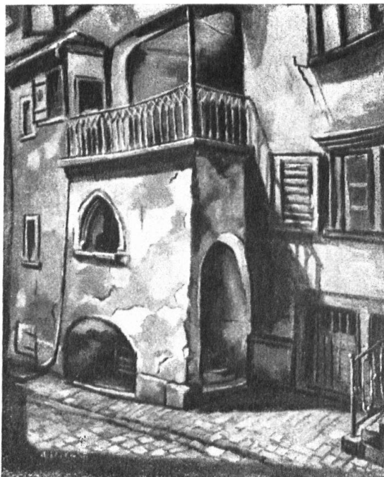
Abb. 7. Hinterhaus zur „Glocke“ in Lichtensteig. Origineller Portalvorbau, vor der „Renovation“. Nach einem Gemälde von Albert Edelmann. — Fig. 7. Détail de la maison «zur Glocke» à Lichtensteig. Portail intéressant, avant la «restauration». D'après un tableau d'Albert Edelmann.

Oberstammheim. Malerei in der Kirche. Im Laufe letzten Jahres ist die Kirche zu Oberstammheim im Kanton Zürich einer Innenrenovation unterzogen worden. Bei Vornahme der Räumungsarbeiten sind am spätgotischen Gewölbe des Chores Spuren alter Frescomalereien zum Vorschein gekommen. Die nähere Untersuchung ergab, dass es sich um ein sehr interessantes Beispiel einer Gewölbemalerei handelt (Abb. 9). Die Gewölbefelder sind in einem bestimmten Rhythmus mit den Bil-