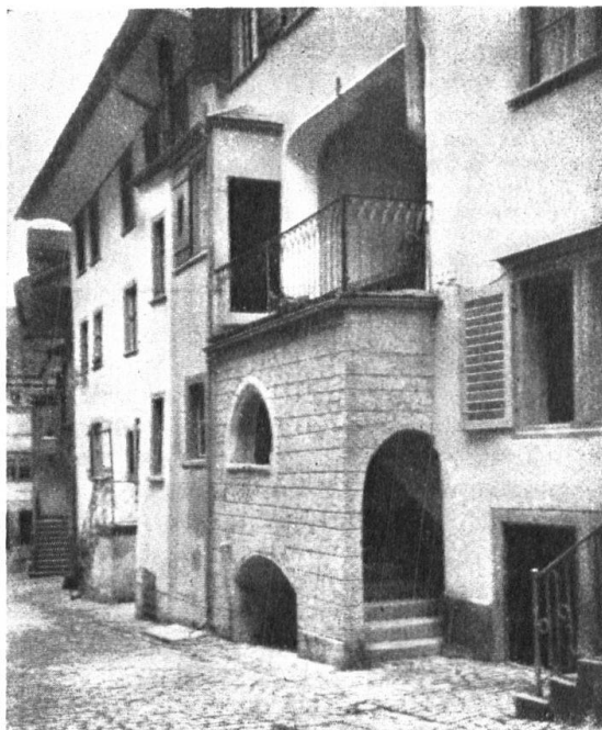
Abb. 8. Portalvorbau zur „Glocke“. Leider mit Zement überkleistert und als Stein-Quaderbau auffrisiert. — Fig. 8. Le même portail rafistolé, recouvert de ciment imitant la pierre de taille.