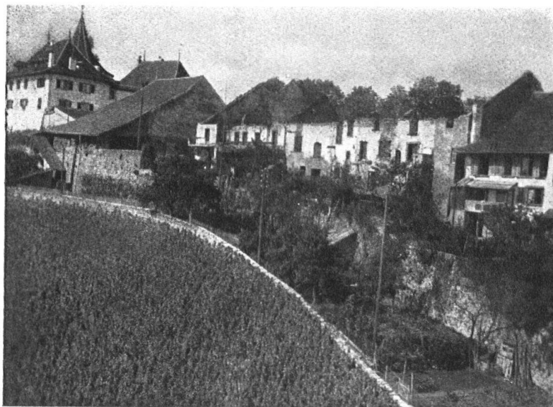
Abb. 12. Die Altstadt von Erlach, nach dem Brande von 1915. — Fig. 12. Cerlier. L'ancienne ville, partie méridionale, après l'incendie de 1915.

siner Dörfern, die bei aller Gruppierung und fein variierten Einzelheiten doch stets durch eine wohltuende und lebendige Einheit erfreuen.