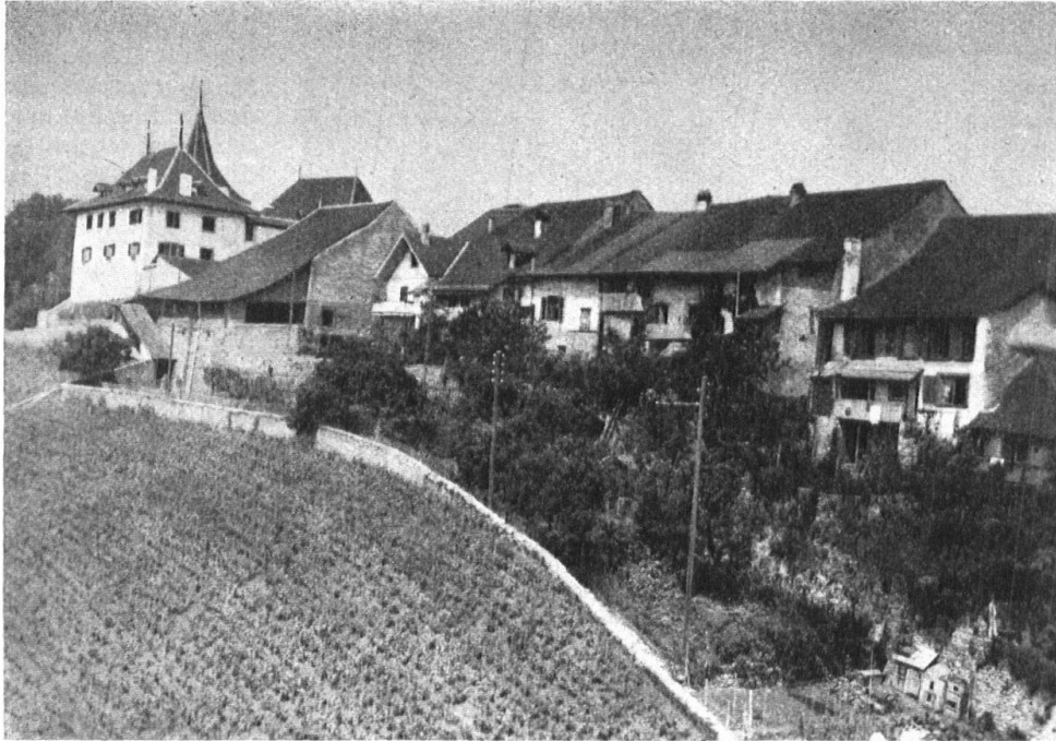
Abb. 10. Erlach. Die Altstadt. Südseite vor dem Brand von 1915. Bei köstlicher Mannigfaltigkeit im Einzelnen, ein einheitliches Bild. — Fig. 10. Cerlier. L'ancienne ville. Quartier du Sud avant l'incendie de 1915. Variété dans les détails, harmonie de l'ensemble.