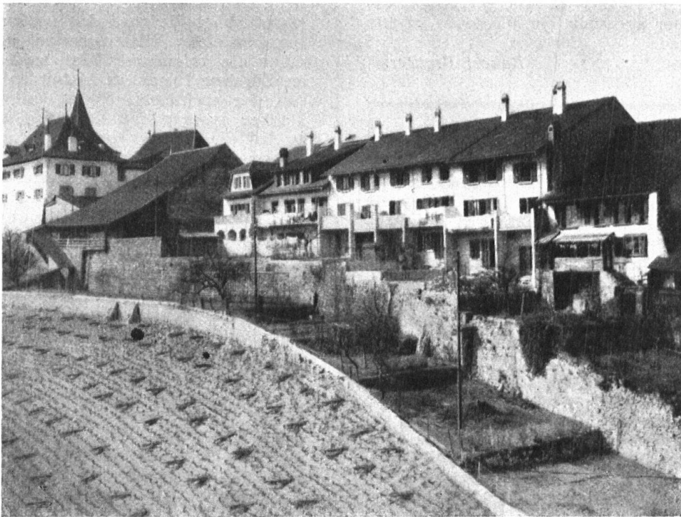
Abb. 11. Die Altstadt von Erlach seit dem Wiederaufbau von 1921. Harte und einförmige Wirkung der neuen Architektur. — Fig. 11. Cerlier, l'ancienne ville depuis sa reconstruction en 1921. Architecture aux lignes monotones et sans grâce.