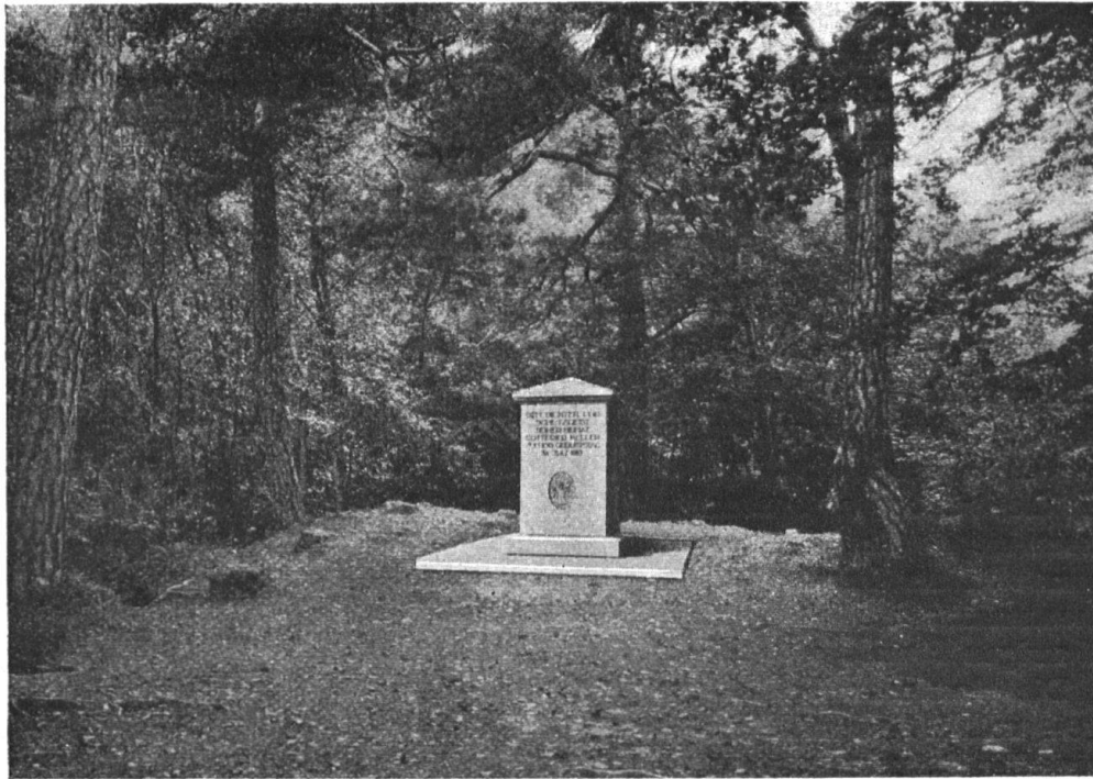
Abb. 19. Der Gottfried-Keller-Gedenkstein in seiner künftigen Umgebung. Architekt Prof. R. Rittmeyer, Winterthur. — Fig. 19. Le monument qui sera élevé par le Heimatschutz à la mémoire de Gottfried Keller, dans son cadre futur. Architecte, M. le Prof. R. Rittmeyer à Winterthur.