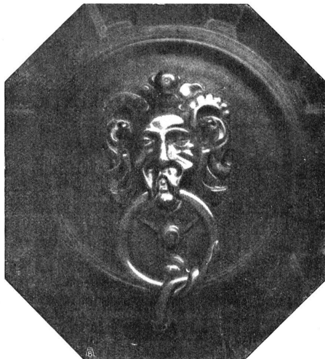
Abb. 15. Türklopfer am Haus „zur Krone“ in Trogen.

Die vier Aufnahmen von Appenzeller Haustüren sind aus der Serie von Eric Steiger in St. Gallen, die an unserm letztjährigen Photographischen Wettbewerb mit einem ersten Preis ausgezeichnet wurde.