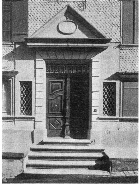
Abb. 14. Türe in Trogen. In der Proportion recht unbekümmert, aber trotzdem ein guter Wurf. — Fig. 14. Porte à Trogen. Proportions hardies et cependant idée heureuse.