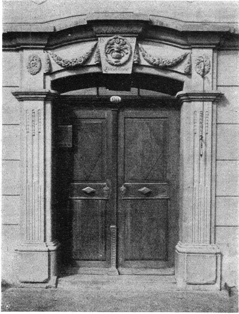
Abb. 13. Türe in Speicher. Der das Haus umziehende Gurt ist schön in die Komposition der Türe gebunden. — Fig. 13. Porte à Speicher. La plinthe qui fait le tour de la maison est harmonieusement combinée à l'architecture de la porte.