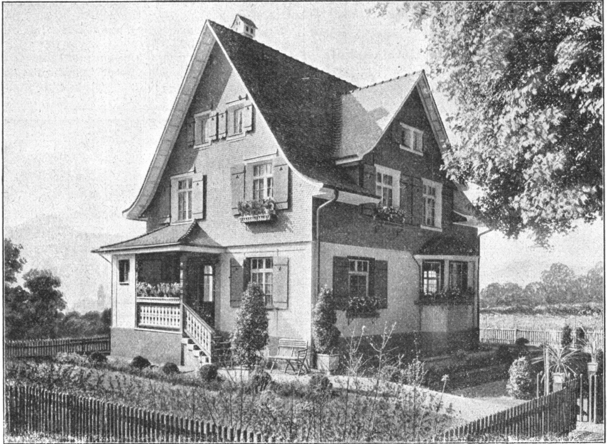
Eternithaus an der Schweiz, Landesausstellung in Bern. Goldene Medaille.