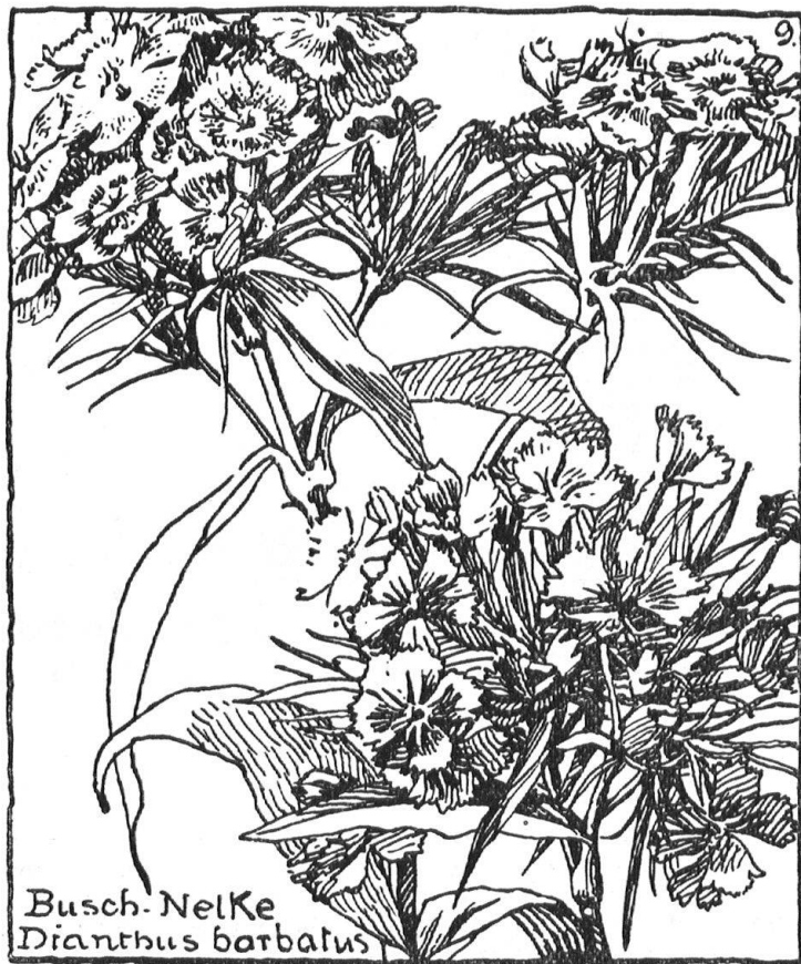
Abb. 8. Verkleinerte Wiedergabe aus „Der Bauerngarten“ von Hermann Christ, illustriert von Maria La Roche. Herausgegeben vom Basler Heimatschutz. — Fig. 8. Reproduction réduite d'une gravure extraite du «Jardin rustique» de Hermann Christ, illustré par Maria La Roche, et édité par la section bâloise du Heimatschutz.

Eine appenzellische Heimatschutzgabe. Das Appenzeller Völklein ist seines fröhlichen Sinnes und seiner Sangeslust wegen bekannt. In nicht minder gutem Sinne zu seiner Eigenart gehört auch seine originelle Tanzmusik (Hackbrett, Violine und Bassgeige), welche man an den öffentlichen Tanzabenden von den Appenzeller Streichmusikanten zu hören bekommt. Wohl kein anderer Kanton hat in seiner Tanzmusik eine solche Mannigfaltigkeit und heitersprudelnde Originalität aufzuweisen. Diesen Volkstänzen schenkte deshalb auch der Heimatschutz schon lange seine Aufmerksamkeit. Sie verdienen sie um so mehr, als die Gefahr besteht, dass sie nach und nach durch fremde, seichte Operettenmusik verdrängt werden könnten. Um dieser Invasion Einhalt zu tun, um das Wertvolle, Köstliche und Unerstzliche unserer heimischen Volksmusik recht vielen zum Bewusstsein zu bringen, um die Pflege alter Appenzeller Musik als eines Stückes heimatlicher Eigenart wieder zu kräftigen, um die