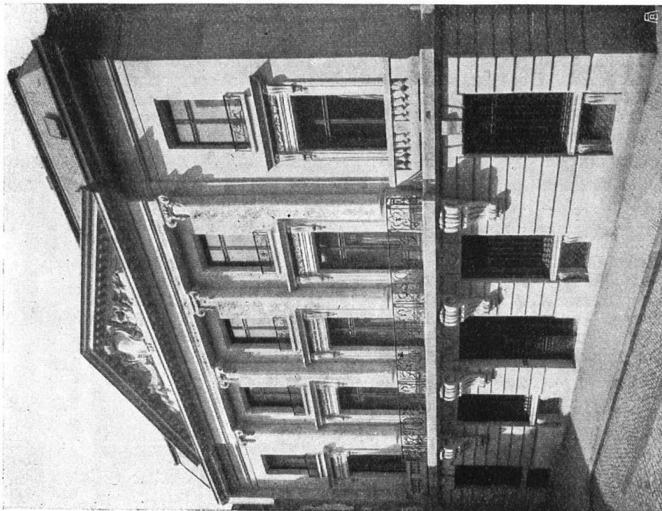
Abb. 18. Bankhaus an der Freien Strasse in Basel, Gediegener Bau vor der Umgestaltung in ein Warenhaus. — Fig. 18. Hôtel de banque distingué dans la Rue Franche à Bâle. L'édifice avant sa transformation en Grands Magasins.