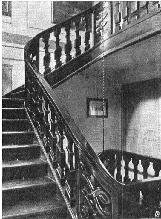
Abb. 11. Treppe im Bossard'schen Hause. Weiträumige Anlage. Schwere Treppengeländer mit reicher Schnitzerei. — Fig. 11. Escalier de la maison Bossard. Ampleur; lourde balustrade richement sculptée.

1913. — Das kleine Buch verdient auch in unserer Zeitschrift eine Würdigung, birgt es doch ein schönes Stück Heimatschutz und ist es auch von Liebe zur Heimat diktiert. Es will eine Darstellung der wichtigsten Volksbräuche des Schweizervolkes in gemeinfasslicher Form bieten. Der auf dem Gebiete der Volkskunde längst unermüdlich tätige Verfasser schöpft aus reichen Quellen, aus den Publikationen der Schweiz. Gesellschaft für Volkskunde und aus dem Idiotikon . In der Hauptsache werden wir mit den Festen und Gebräuchen bekannt gemacht, die im 19. Jahrhundert in unserm Lande zu Recht bestanden und zum Teil heute noch geübt werden; sie werden knapp ausgeführt und bilden so ein treues Spiegelbild volkstümlichen Lebens. In einer Zeit, da Industrie und Ausländertum die alten Sitten unseres Volkes verschwinden machen, ist es wertvoll, zu sammeln, was noch lebendig ist oder in der Erinnerung lebt. Der Verfasser scheidet seine Gebräuche in Marksteine im Leben des Menschen, in nicht-kalendare Volksfeste und Volksgebräuche und in kalendare Feste und Bräuche. Die Darstellung erfreut durch ihre anschaulichen, wenn auch gedrängten Schilderungen und durch die Fülle des behan-