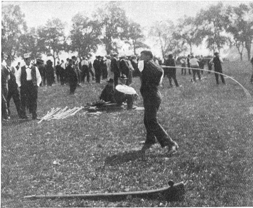
Abb. 7. Beim Hornussen. Absenden des Hornuss. Fig. 7. Joueurs de hornussen. Le lancement du projectile.

sind die Älplerfeste mit ihrem Steinstossen und dem Schwingen sicher reich genug! — Ihnen schliessen sich die Hornusserfeste an, welche die Spieler eines echt schweizerischen Rasenspieles jeweils vereinigen; hier kommt weniger ein Älplerbrauch zur Geltung als ein Bauernspiel des Mittellandes, das erfreulich grosse Anhängerschaft