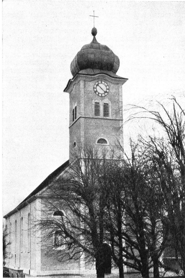
Abb. 18. Der Kirchturm nach der glücklichen Renovation. Gutes Beispiel. Das Kupferdach hat breite, behäbige Formen von so künstlerischen Proportionen, dass seine Wirkung rassig und elegant zugleich ist.