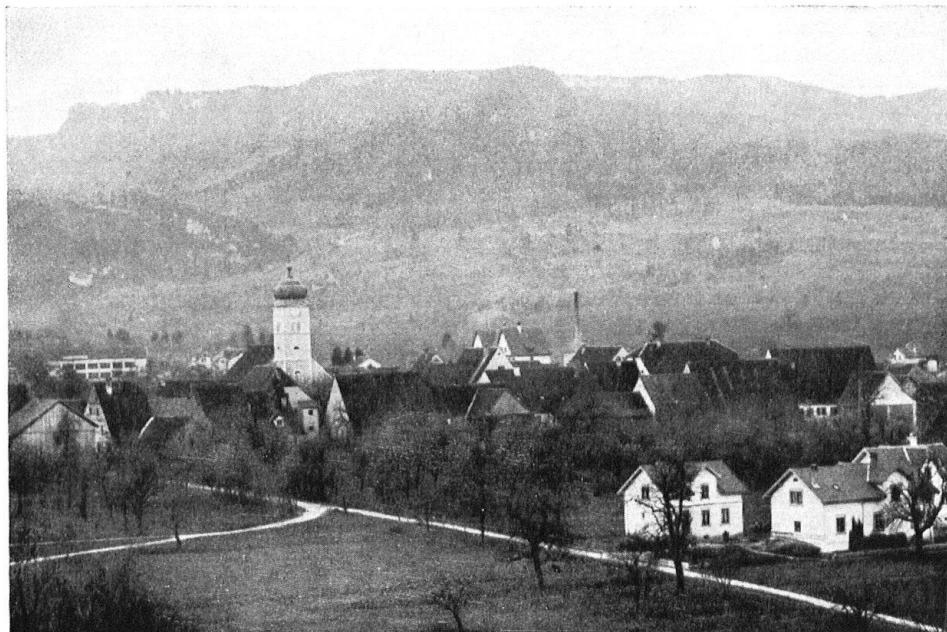
Abb. 19. Der Kirchturm im Dorfbilde. Vorbildliche Harmonie des Neuen mit dem Alten; der neue Turmhelm wird zum Wahrzeichen des Ortes, ohne sich, weder durch Form noch durch Farbe, vorzudrängen. — Fig. 19. Le clocher dans son entourage. La nouvelle tour est en parfaite harmonie avec le paysage. Elle exprime fort bien le caractère local sans trop attirer l'attention soit par ses lignes, soit par ses couleurs. Zum Wettbewerb für Breitenbach (Kanton Solothurn). — A propos du concours de Breitenbach (Canton de Soleure).