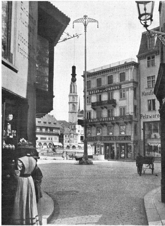
Der Weinplatz mit dem Riesenkandelaber. Le «Weinplatz» avec le nouveau réverbère.