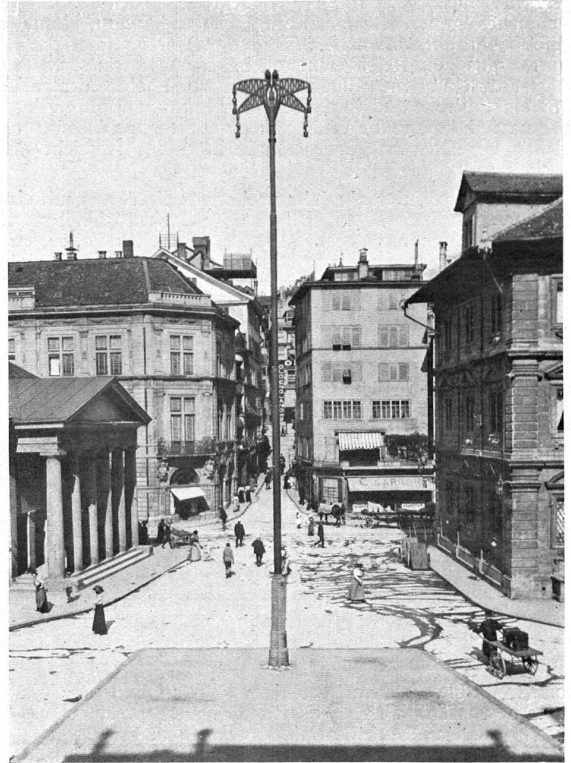
Die Gemüsebrücke mit dem Riesenkandelaber. Le nouveau réverbère sur la Gemüsebrücke.