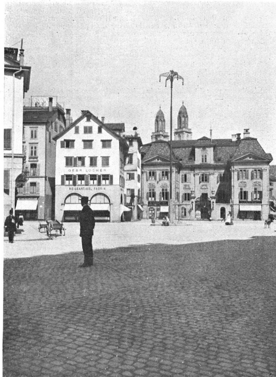
Der Münsterhof mit dem Riesenkandelaber. Le «Münsterhof» avec le nouveau réverbère.