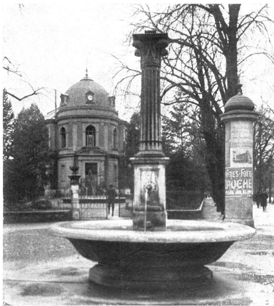
La même, défigurée par une colonne d'affichage. Ein stimmungsloses Strassenbild.