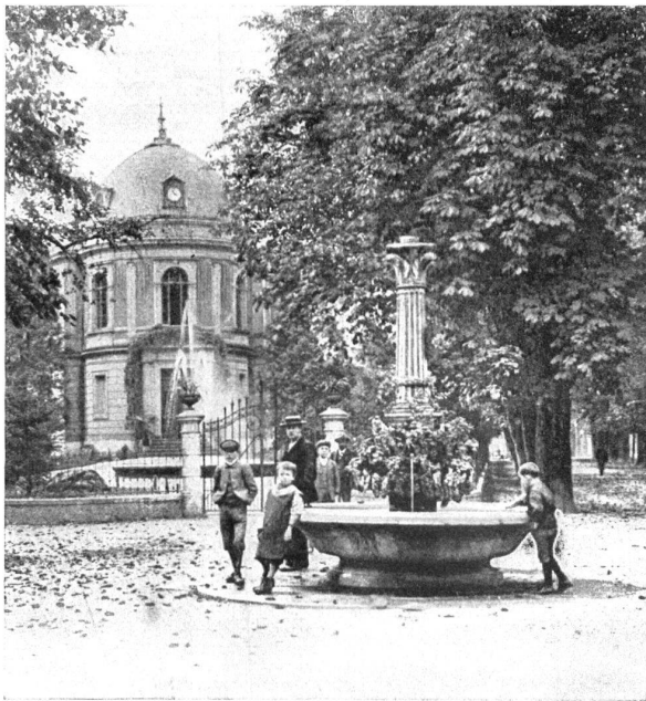
Une petite place, élégante et gaie. Ein stimmungsvolles Strassenbild. Vergl. den Begleittext S. 39 oben.