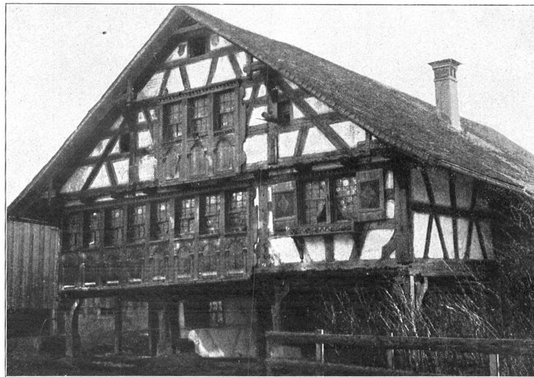
DAS GERICHTSHAUS ZU BURG AU bei Flawil (1639) in seinem Bestand gesichert durch ein Vorkaufsrecht der st. gallischen Vereinigung für Heimatschutz LA MAISON DU TRIBUNAL A BURG AU près Flawil (1639), protégée contre la démolition par la section saintgalloise du Heimatschutz (Vergl. die Beschreibung des Hauses durch Baumeister Sal. Schlatter, Ankündigungsnummer, S. 2.)