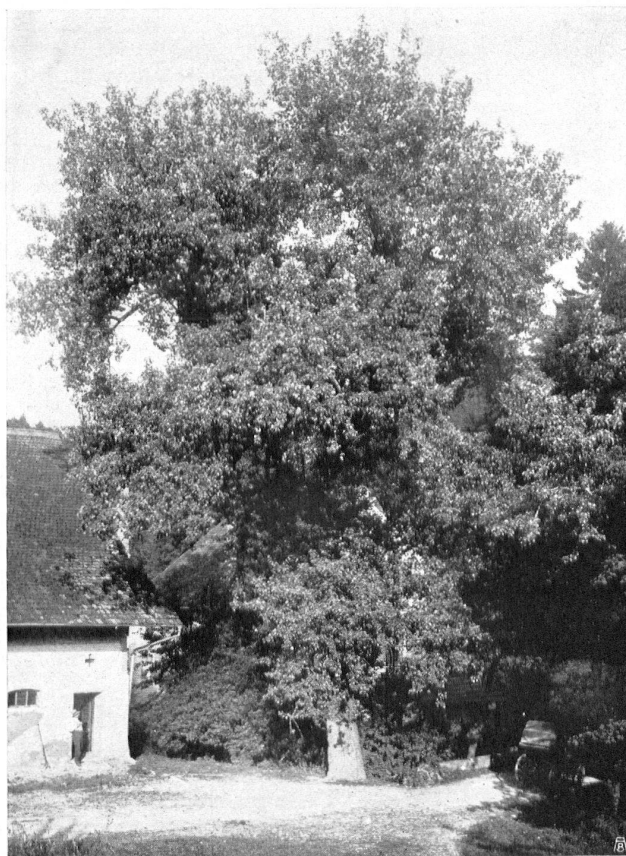
SILBERPAPPEL IM SCHLOSSGUT EIGENTHAL BEI FLAACH im Kanton Zürich. Der Besitzer beabsichtigt den Baum zu fällen! PEUPLIER BLANC A EIGENTHAL PRÈS FLAACH, Ct. de Zurich. Le propriétaire a l'intention de l'abattre!

Il nous a donc paru opportun de résumer ici l'état actuel de la question. Et puisse se répandre cette vérité que la beauté de nos forêts est un objet d'utilité publique. Les nombreux amis de la ligue pour la protection de la Suisse pittoresque auront à cœur d'y contribuer aussi.