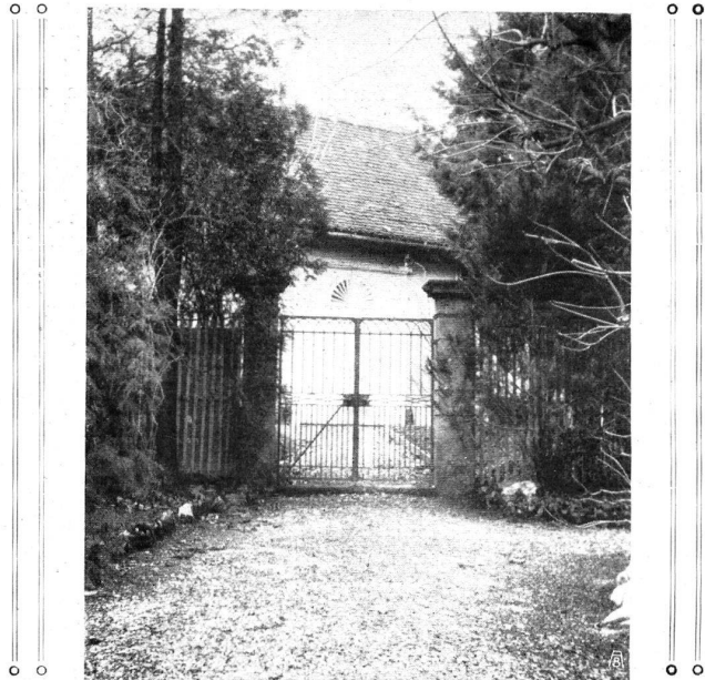
==== BEISPIEL: Einfaches und doch schönes altes Gartentor aus Glarus. ==== BON EXEMPLE: Un portail très simple à Glaris