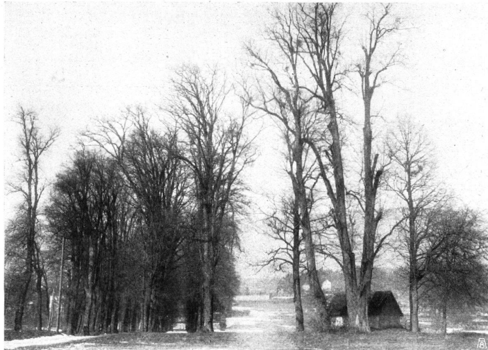
==== DIE FÖGEZ-ALLEE BEI SOLOTHURN im Winter ==== UNE ALLÉE PRÈS SOLEURE en hiver

An einem der Diskussionsabende des solothurnischen Gartenbauvereins, an dem über die Erhaltung interessanter Bäume und Pflanzen gesprochen wurde, kam auch die Fögez-Allee zur Sprache; es wurde dabei die Frage aufgeworfen, ob es nicht zweckmässig wäre, neben der jetzigen Allee etwas westlich derselben eine Linden-Allee mit schon möglichst entwickelten Bäumen zu setzen, und dann die bestehende Allee so lange zu erhalten, bis die neue Allee sich einigermaßen gehörig ausgewachsen habe und Schatten spendend Ersatz biete. Auch wurde darauf aufmerksam gemacht, dass bei Behandlung der Fögez-Allee- Angelegenheit Rücksicht auf die Entwicklung des Steingrubenquartiers und dessen zweckmässige Verbindung mit der Stadt zu nehmen sei, alles Fragen, die gründlicher und unbefangener Untersuchung bedürfen.