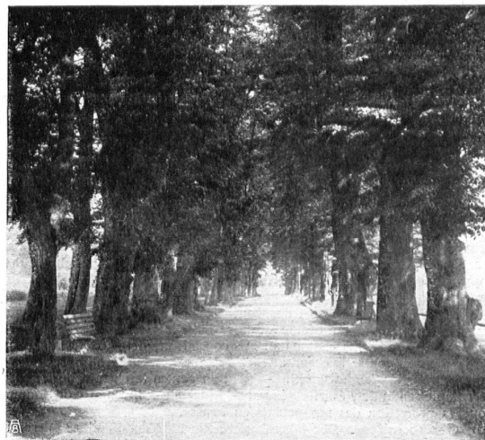
==== DIE FÖGEZ-ALLEE BEI SOLOTHURN im Sommer ==== ===== UNE ALLÉE PRÈS SOLEURE en été =====