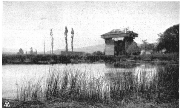
DER BURGWEIHER BEI SCHÖNENWEGEN. Ein malerischer Teich mit altem Tröckneturm aus der Zeit der Leinwandindustrie und reichen Baumbeständen. Der Zukunftspark des Westquartiers

LA FORÊT DES HÊTRES DE ST-FIDEN. Seule forêt de bois feuillu de cette contrée, propre à devenir le parc de l'Est. Espérons qu'on saura la conserver.