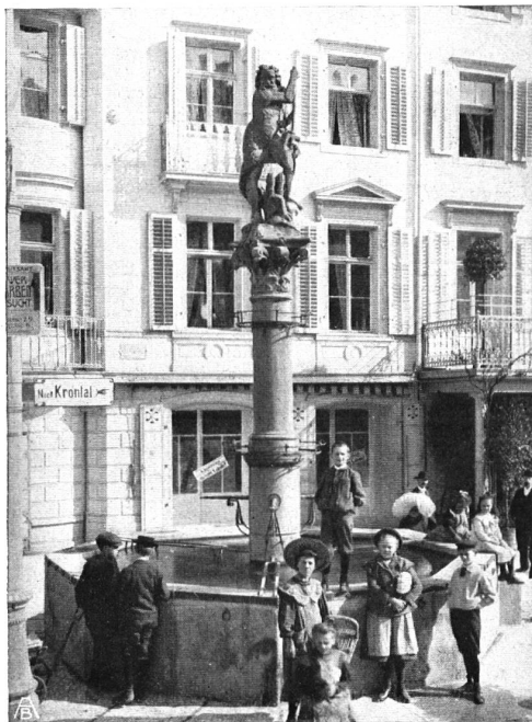
DER NEPTUNBRUNNEN AUF DEM THEATERPLATZ ZU ST. GALLEN. Der einzige erhaltene alte Figurenbrunnen der Stadt, für Viele nichts weiteres als ein Verkehrshindernis. FONTAINE DE NEPTUNE SUR LA PLACE DU THÉÂTRE. Seule fontaine monumentale de Saint-Gall.

„Schulpalästen“ Verwendung finden. Die angegebenen Kostensummen entsprechen somit vollständig den Tatsachen, und da auch die örtlichen wie baulichen Zustände in Reiden durchaus keine abnormen sind, kann das vorliegende Projekt einer eingeschossigen Schulhaus-Anlage trotz aller Entgegnungen mit vollem Recht als gutes, in ähnlichen Verhältnissen äusserst nachahmenswertes Beispiel hingestellt werden.