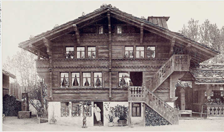
Chalet im Village Suisse an der Landesausstellung Genf (1896) Le chalet du Village suisse à l'Exposition nationale de Genève (1896)