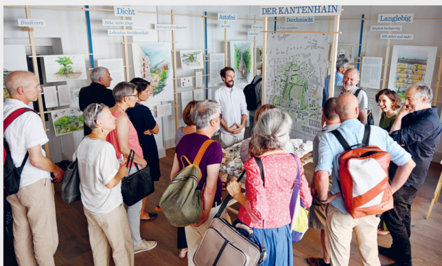
Mehr für alle: Ruggenrecher in Chur Sektion Graubünden, 1. bis 15. September 2024, Ausstellung in Chur (GR)