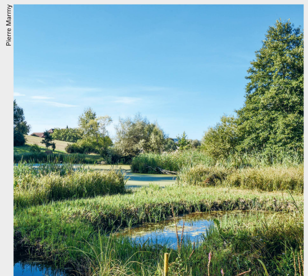
Wässermatten des Klosters St. Urban Les prairies inondables du monastère de Saint-Urbain

Bei den Akteuren gibt es noch einen grossen Wunsch. Der Kanton Bern möge doch nachziehen und die einzigartige Kulturlandschaft mit der traditionellen Bewirtschaftung als Kulturdenkmal ausscheiden. ■