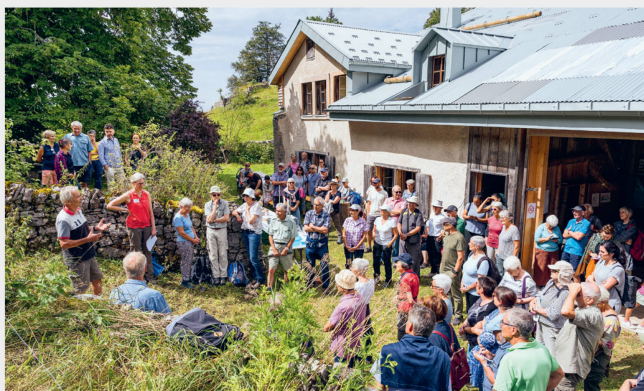
Ferme des Mollards-des-Aubert Clou rouge, 17 août 2024, Le Chenit (VD)