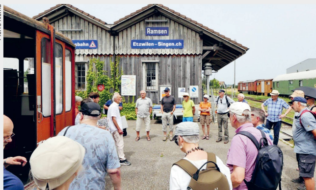
Baukultur und Biodiversität Sektion Schaffhausen, 29. Juni 2024, Rundgang durch Ramsen (SH)