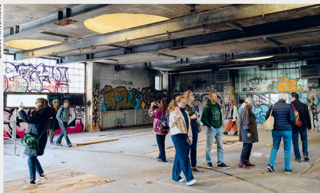
Porteous, ancien bâtiment de la station d'épuration Clou rouge, 14 septembre 2024, Aïre (GE)