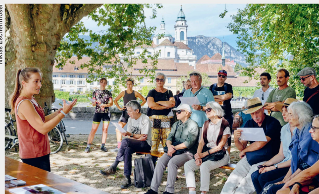
Eine Stadt passt sich dem Klimawandel an. Sektion Solothurn, 7. September 2024, Solothurn (SO)