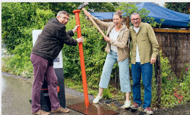
Maison en bois restaurée avec son jardin à Estavannens Clou rouge, 22 juin 2024, Estavannens (FR)