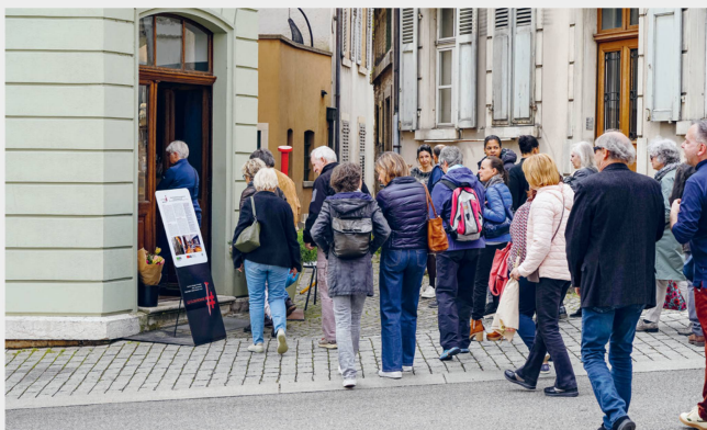
Transformation d'une maison en concept store et café Clou rouge, 27 avril 2024, à Delémont (JU)