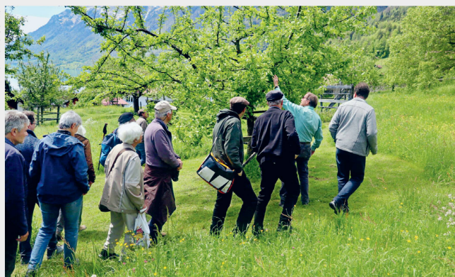
Rundgang Baukultur – Klima – Artenvielfalt Sektion Bern, 4. Mai 2024, Oberschwanden bei Brienz (BE)