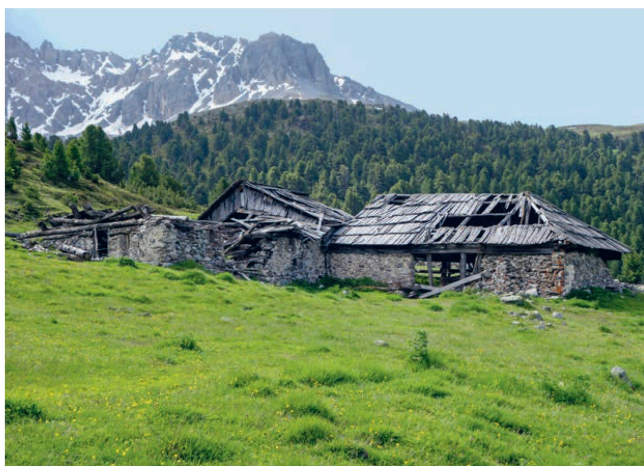
Das Alpgebäude stammt aus dem Jahr 1777, die Viehschermen wurden 1810 erbaut. Da die Gebäude lange nicht unterhalten worden waren, verfielen sie mit der Zeit.

Le bâtiment principal date de 1777 alors que les annexes ont été construites en 1810. Comme l'ensemble n'était plus entretenu, il tombait peu à peu en ruine.