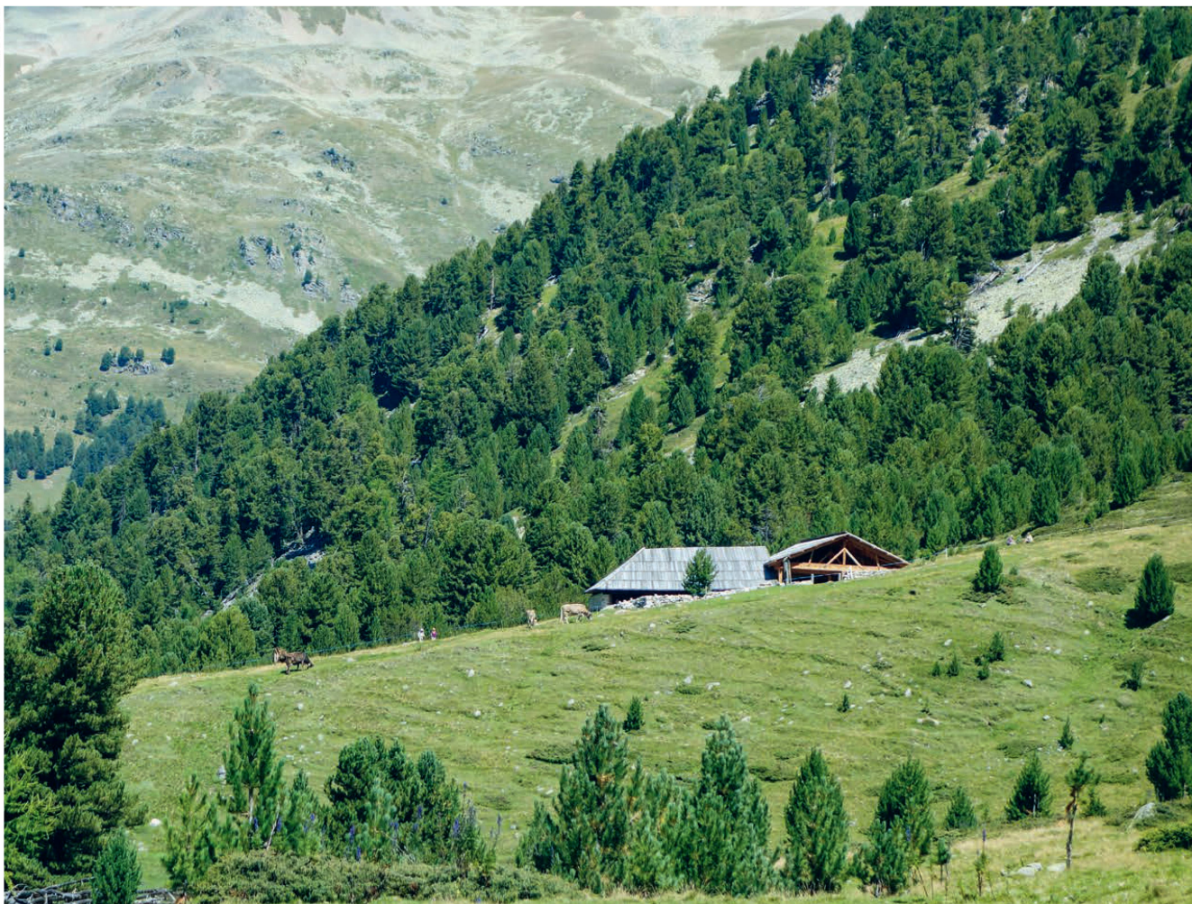
Die restaurierten Gebäude der Alp Tamangur Dadora, umgeben vom Naturwaldreservat God da Tamangur im Unterengadin Les bâtiments restaurés de l'Alp Tamangur Dadora se situent au cœur de la réserve naturelle de God da Tamangur, en Basse-Engadine.

Alpgebäude prägen die Kulturlandschaft der Alpen und des Juras in besonderem Masse. Modernisierungen brachten ab der zweiten Hälfte des 19. Jahrhunderts zwar gewisse Arbeitserleichterungen mit sich, aber auch ähnliche Probleme wie in den Talbetrieben.