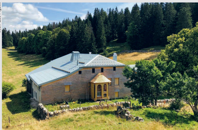
Le Chenit (VD), le 17 août: ferme des Mollards-des-Aubert