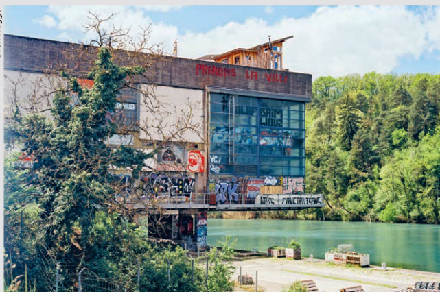
Aïre (GE), le 14 septembre: Porteous, ancien bâtiment de la station d'épuration