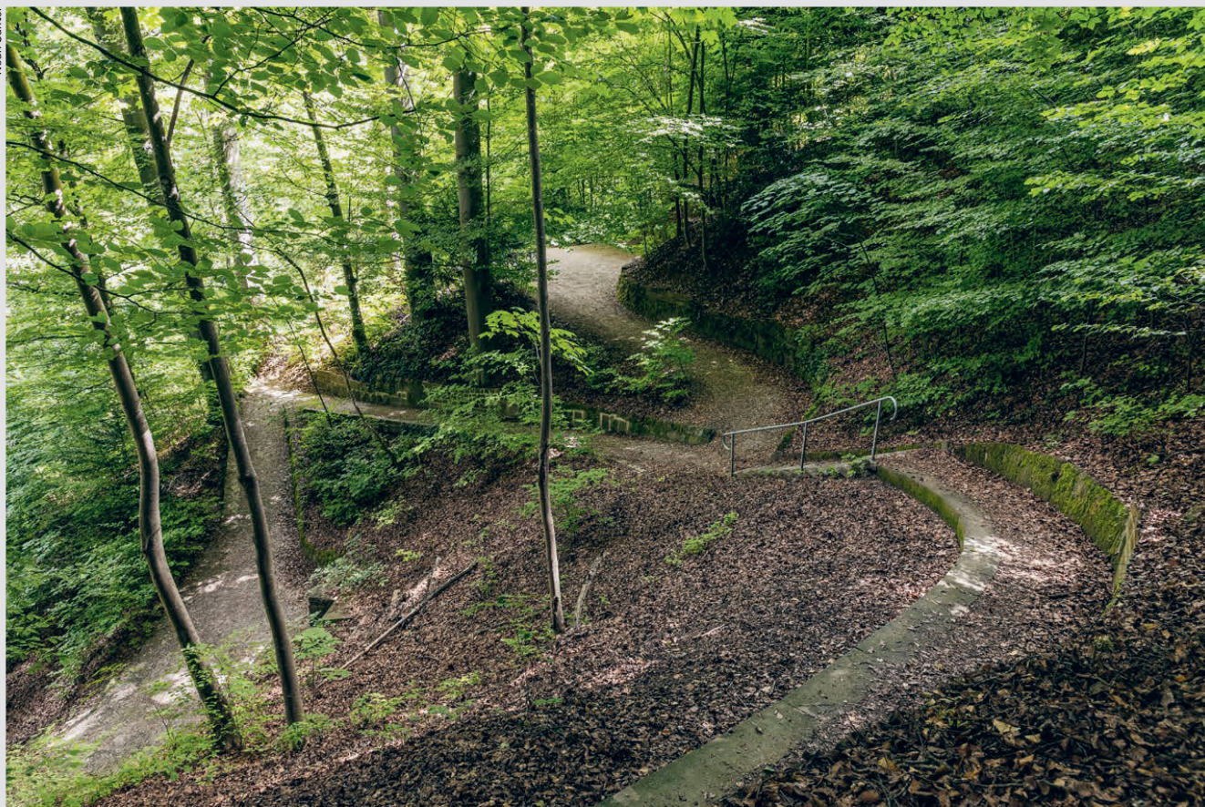
Seit der Sanierung sind die Englischen Anlagen für die Bevölkerung als Naherholungsgebiet zwischen Kirchenfeld und Aare von grossem Wert. Depuis l'assainissement, le parc Englische Anlagen est un lieu de détente très apprécié de la population, entre le Kirchenfeld et l'Aar.

Zusammen mit dem Kirchenfeldquartier entstand in der Belle Époque am steilen Hang des Aareufers eine geschwungene Promenade, die später um eine Parkanlage, zwei Plätze und diverse Wege erweitert wurde. Der Verschönerungsverein Bern begann mit dem Projekt auf einer ehemaligen Deponie 1911, acht Jahre später breiteten sich die Englischen Anlagen gegen Osten aus.