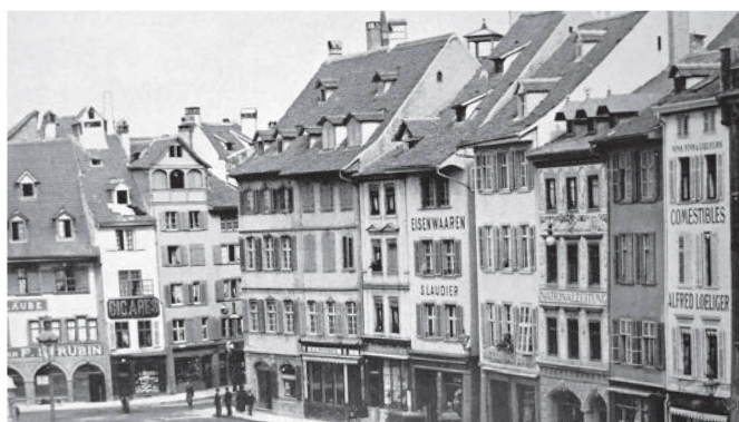
Marktplatz 1895 La Marktplatz en 1895