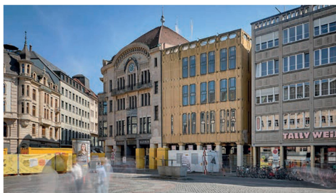
Marktplatz heute La Marktplatz aujourd'hui