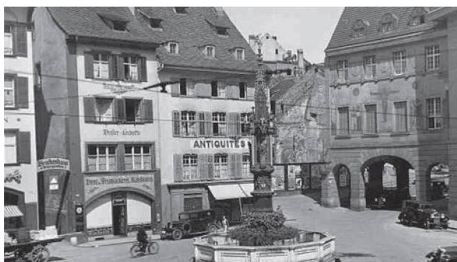
Fischmarkt und Spiegelhof um 1929 Le Fischmarkt et le Spiegelhof vers 1929