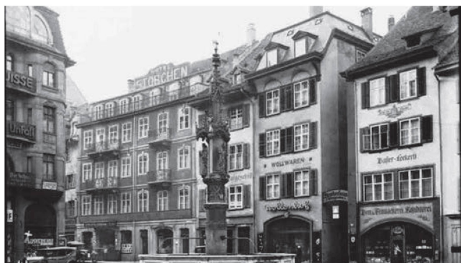
Hotel Storchen am Fischmarkt um 1930 L'Hôtel Storchen sur le Fischmarkt vers 1930