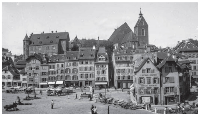
Barfüsserplatz um 1880 La Barfüsserplatz vers 1880