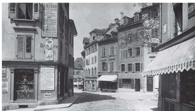
Freie Strasse zwischen Barfüssergasse und Bäumleingasse vor 1895 La Freie Strasse, entre la Barfüssergasse et la Bäumleingasse, avant 1895