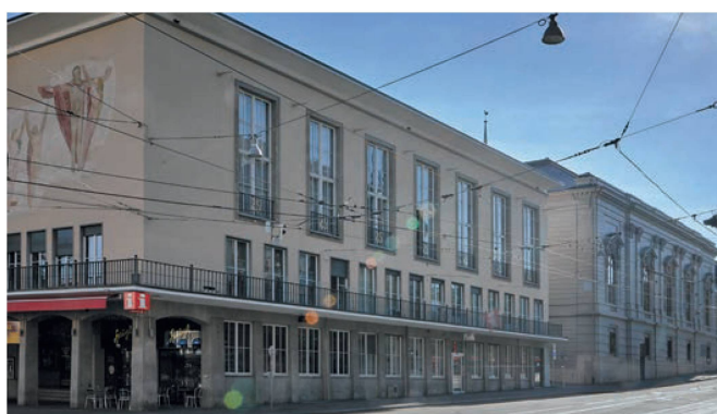
Stadtcasino und Musiksaal Steinberg heute Le Casino et la salle Steinberg aujourd'hui