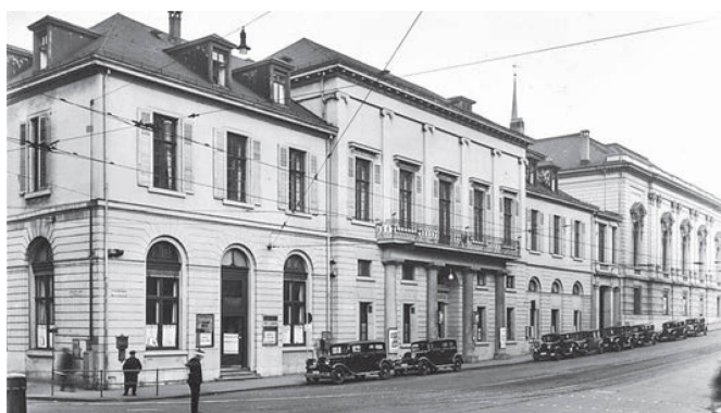
Stadtcasino und Musiksaal Steinberg 1934 Le Casino et la salle Steinberg en 1934