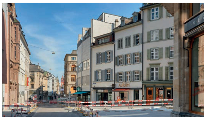
Freie Strasse zwischen Barfüssergasse und Bäumleingasse heute La Freie Strasse, entre la Barfüssergasse et la Bäumleingasse, aujourd'hui