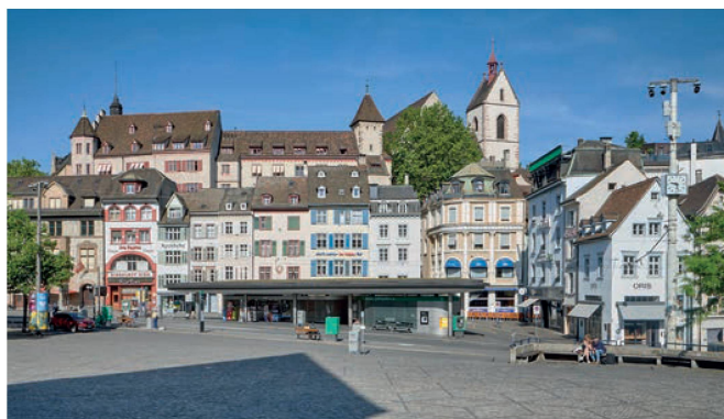
Barfüsserplatz heute La Barfüsserplatz aujourd'hui