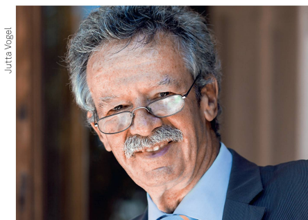
Martin Killias Präsident Schweizer Heimatschutz

Ein Missverständnis gilt es auszuräumen: Rekonstruktionen von Gebäuden, die man zuvor abzureissen beschliesst, um sie nachher «gleich schön wie vorher» wieder aufzubauen, nur weil sich so etwa eine Tiefgarage leichter unter dem Schutzobjekt erstellen lässt, sind keine denkmalpflegerische Option. Wie die Eidgenössische Kommission für Denkmalpflege jedoch präzisiert, stellen die hier geschilderten Beispiele nicht Rekonstruktionen, sondern Reparaturen dar. Dagegen gab es nie etwas einzuwenden, weder früher noch heute!