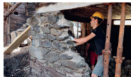
Stiftung Baustelle Denkmal

Die Stiftung Baustelle Denkmal macht vorwärts mit der Rettung des Heidehüs (vgl. Heimatschutz/Patrimoine 1/2020): Im Juli und August wurden erste Instandstellungsarbeiten am Strickbau und am Mauerwerk sowie Bauforschungsarbeiten ausgeführt. 22 Teilnehmer/innen beteiligten sich während sechs Wochen tatkräftig an den anfallenden Sanierungsarbeiten, die durch kundige Fachpersonen angeleitet wurden.