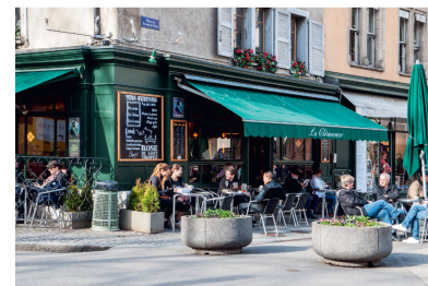
La Clémence, Genève (GE)

À commander avec le talon ci-contre ou sur www.patrimoinesuisse.ch/shop