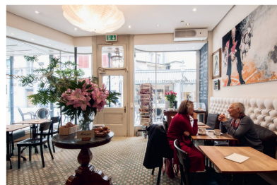
Café Bar Mardi Gras, Luzern (LU)

Zu bestellen mit portofreier Karte auf der Innenseite oder unter www.heimatschutz.ch/shop