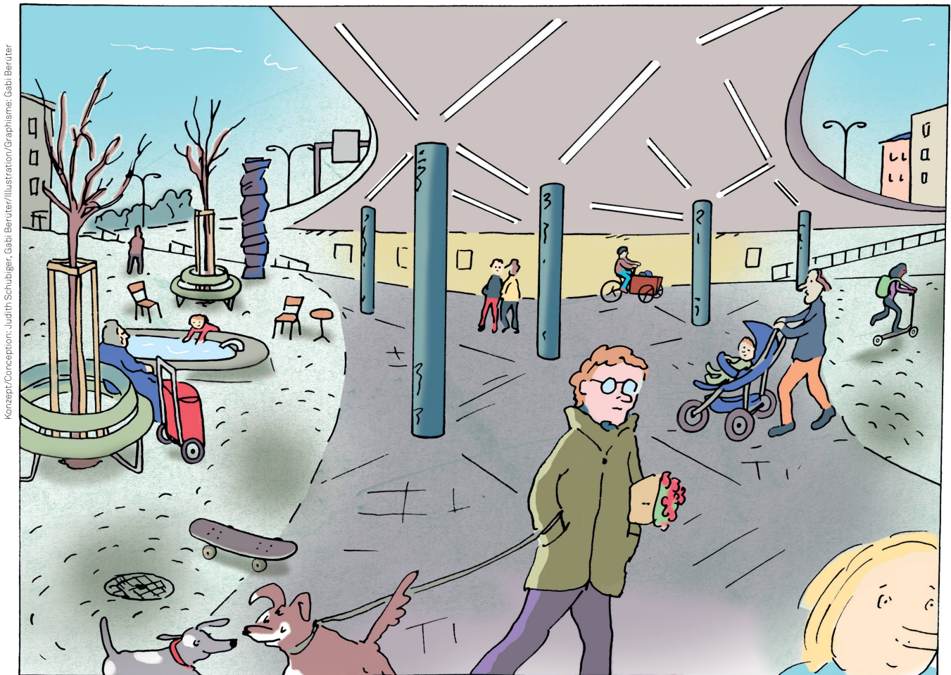
Konzept: Conception: Judith Schubiger, Gabi Beruter / Illustration: Graphisme: Gabi Beruter

Les villes ont longtemps été conçues pour que les voitures et les camions aient le plus de place possible. Les piétons et les cyclistes étaient mis à l'écart et devaient parfois passer par-dessous. Connais-tu une voie souterraine destinée aux piétons? Il ne s'en construit presque plus aujourd'hui. Et les anciennes sont rénovées de manière à laisser beaucoup d'espace aux piétons et aux utilisateurs de trottinettes et de skateboards afin qu'ils n'aient pas l'impression d'être «sous terre».