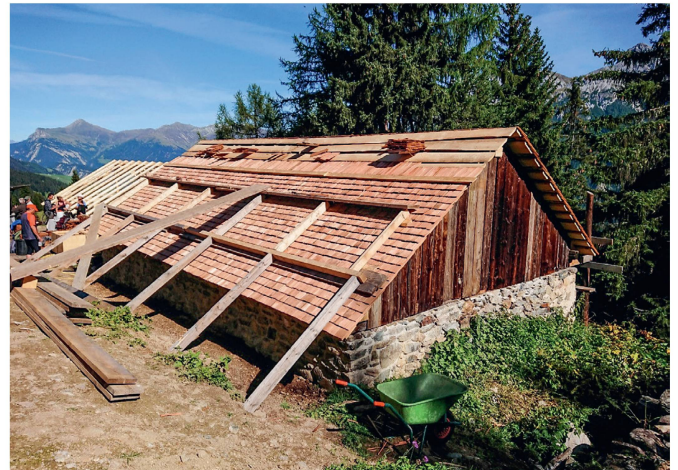
Die Bauten des Maiensässes Chant Sura, gerettet durch Zivildienstleistende Les bâtiments des mayens de Chant Sura, sauvés par des civilistes