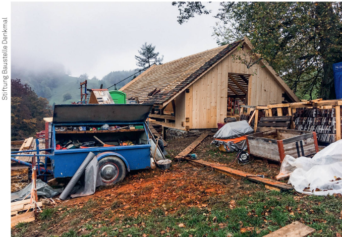
Die Feldscheune Laimenrain, im Herbst 2019 instand gestellt La grange à foin de Laimenrain, remise en état durant l'automne 2019