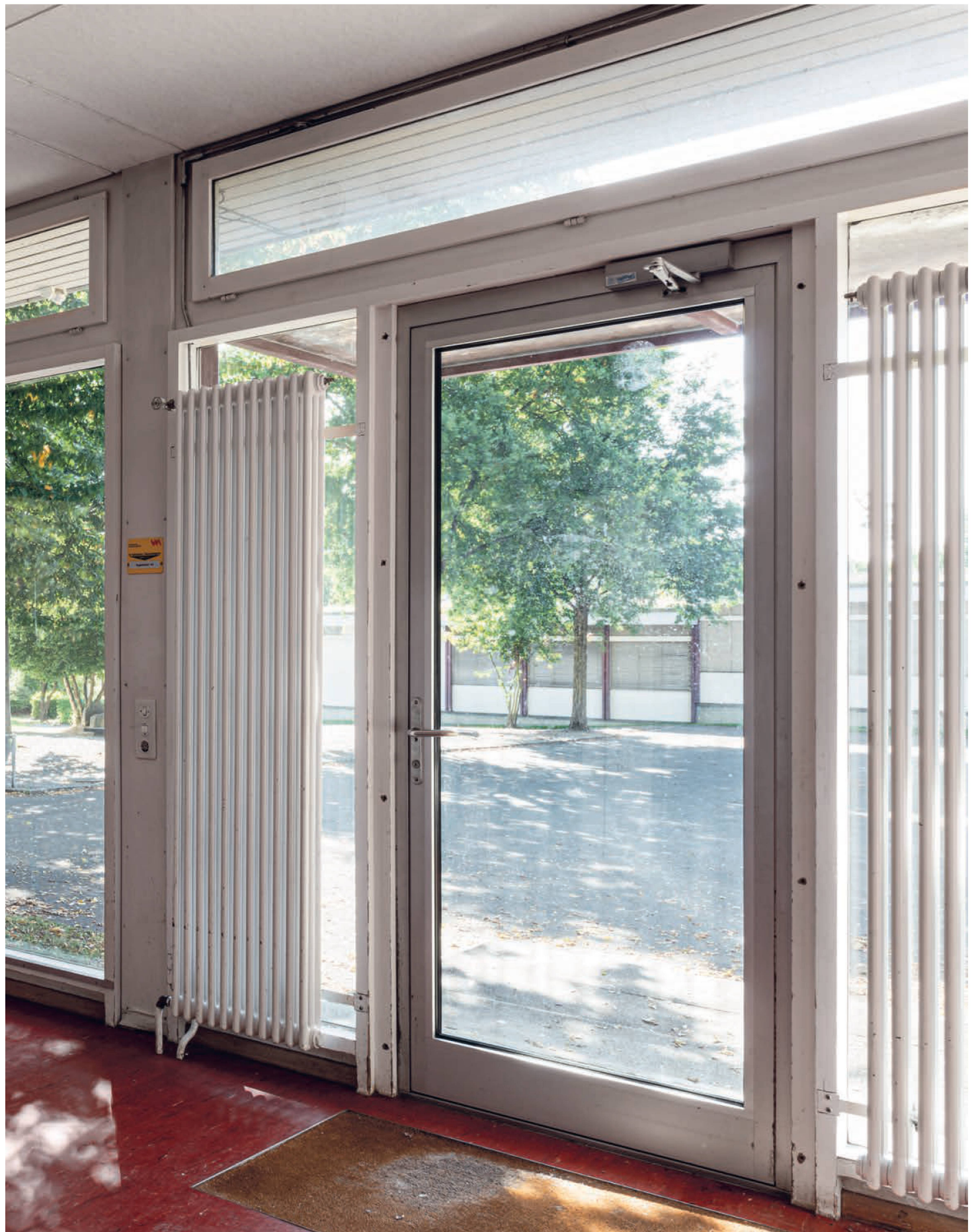
Le pavillon scolaire Variel de Winterthour-Wallrüti: par de grandes baies vitrées, on peut voir la cour d'école encerclée de bâtiments Variel. Une bande foncée et nervurée confère au hall d'entrée un horizon plus élevé. Elle est en harmonie avec les portes en bois et le linoléum rouge marbré.