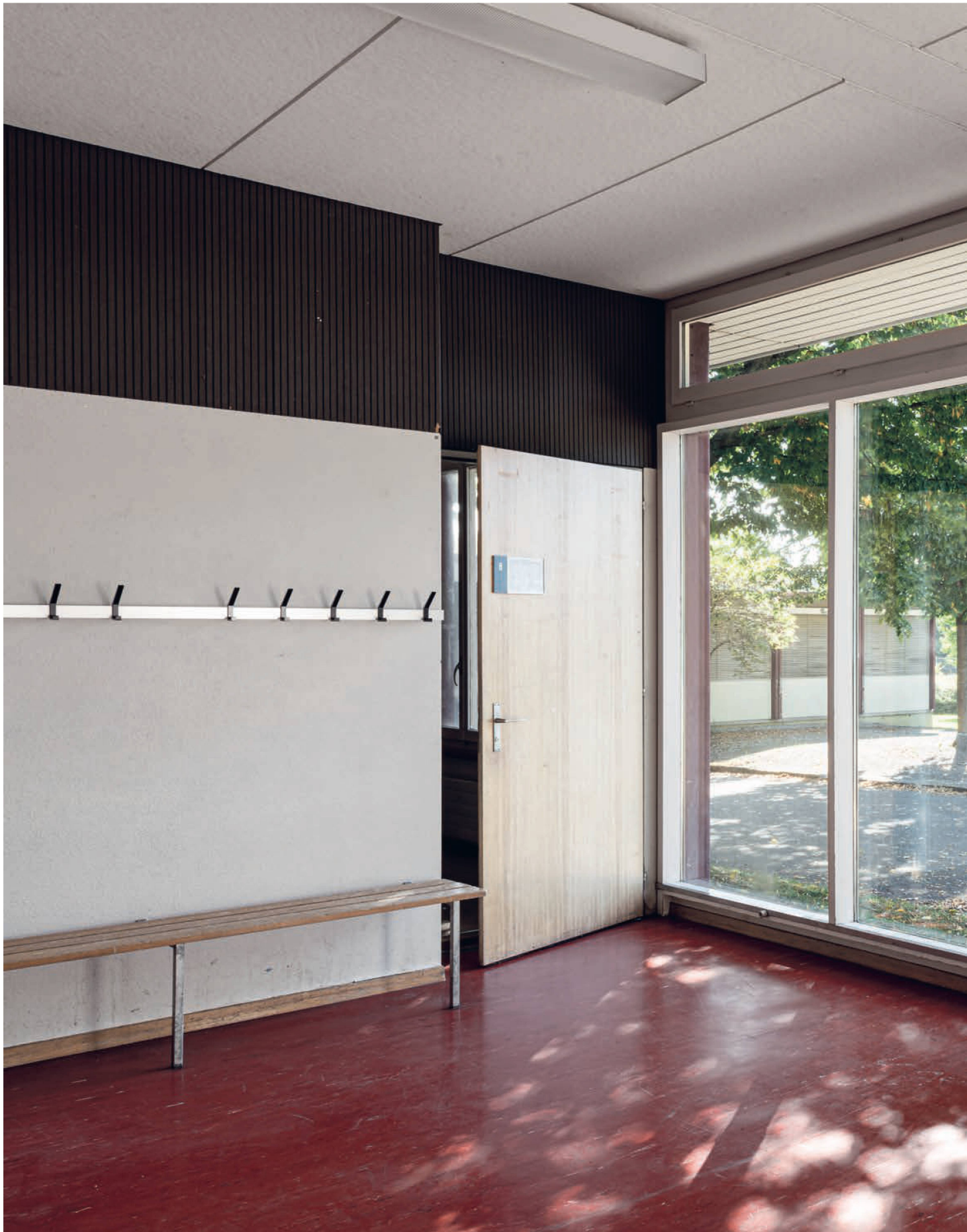
Variel-Schulpavillon in Winterthur-Wallrüti: Durch eine grosse Glasfront blickt man auf den Schulhof, der von den Variel-Bauten eingefasst wird. Ein dunkles, geripptes Band gibt dem Eingangsraum einen oberen Horizont. Es harmoniert mit den holzsichtigen Türen und dem rot marmorierten Linoleum.