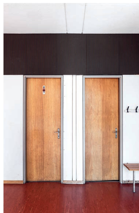
Oliver Marc Hanni

De même, les enfants qui ont fréquenté l'école de Wallrüti pourraient raconter beaucoup d'histoires sur le système Variel qui est l'expression d'une époque où la génération des grands-parents et des arrière-grands-parents des élèves actuels ont lancé de nouveaux procédés de construction qui ont marqué durablement la société et notre environnement construit.