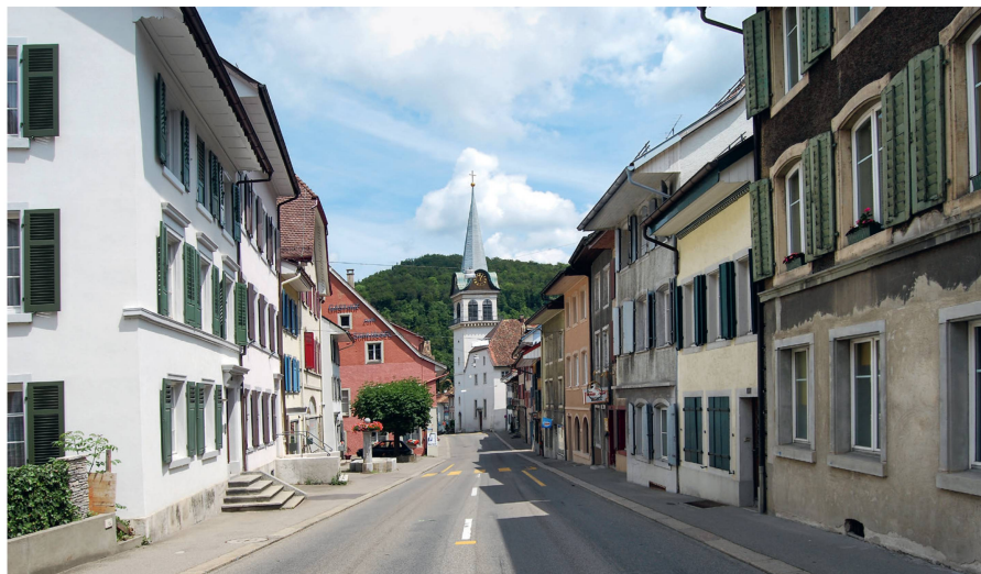
Das Stedtli Waldenburg im Kanton Baselland

Der Anlass im Alten Schulhaus fand reges Interesse. Der Saal war voll, über drei Viertel der Anwesenden waren aus Waldenburg. EspaceSuisse skizzierte in ihrer Stadtanalyse mögliche Interventionen, die mit geringem Aufwand umgesetzt werden können. Die Architekturstudenten der FHNW zeigten einen anderen Weg: Die wenig attraktive Freifläche vor dem Schulhaus sollte mit architektonischen Mitteln der Aussenraumgestaltung und neuen Gebäuden aufgewertet werden und so eine langfristige und andauernde Attraktivitätssteigerung für das Stedtli bringen. Eine Podiumsdiskussion gab Gelegenheit zu weiteren Klärungen, Erläuterungen und Fragen aus dem Publikum. Dabei blieb unklar, wie das weitere Vorgehen