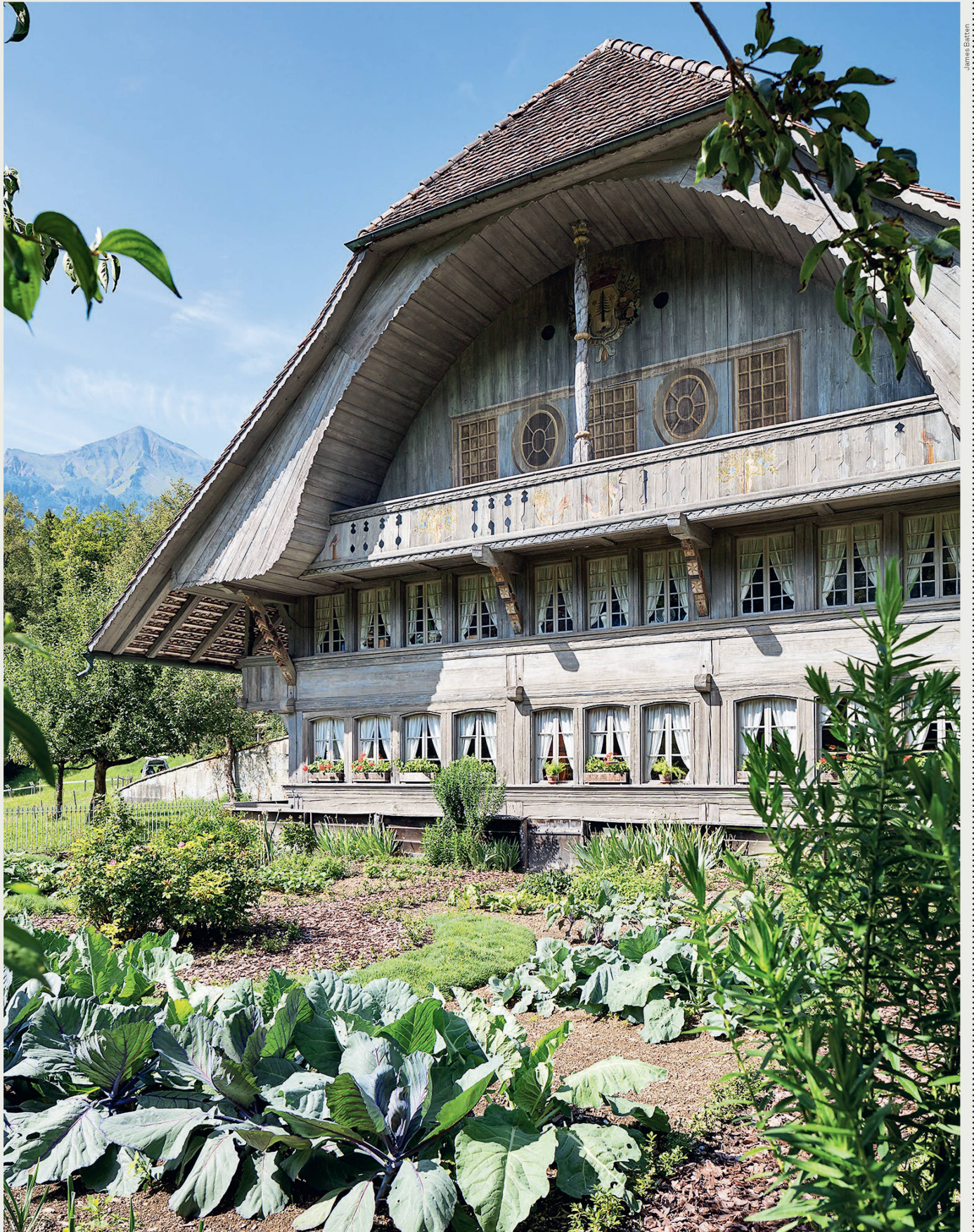
Depuis sa création, le Musée en plein air Ballenberg s'est consacré au maintien de la culture paysagère traditionnelle et à sa transmission active. En décernant le Prix Schulthess des jardins 2018, Patrimoine suisse a distingué un engagement de longue haleine en faveur de cet important héritage culturel.