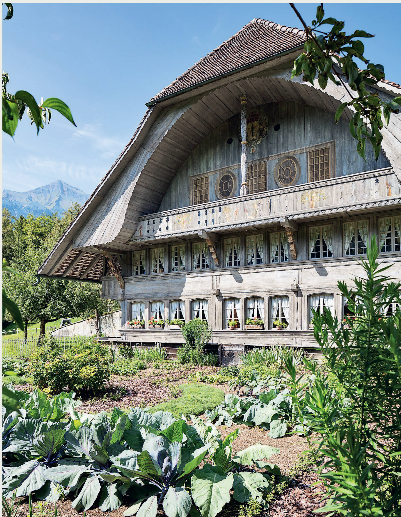
Depuis sa création, le Musée en plein air Ballenberg s'est consacré au maintien de la culture paysagère traditionnelle et à sa transmission active. En décernant le Prix Schulthess des jardins 2018, Patrimoine suisse a distingué un engagement de longue haleine en faveur de cet important héritage culturel.