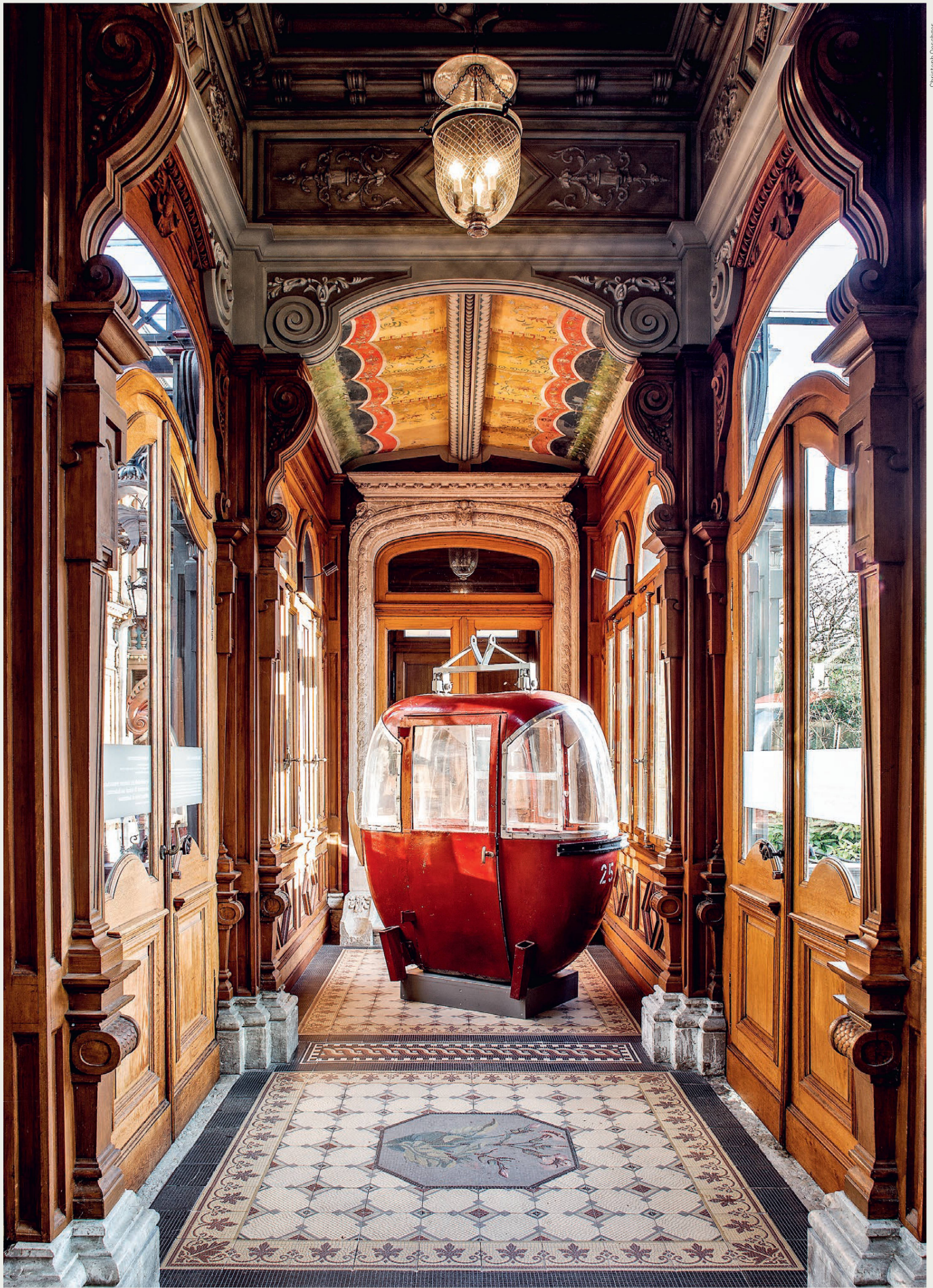
Die Sonderausstellung «Luft Seil Bahn Glück. Oldtimer und Newcomer» im Heimatschutzzentrum in der Villa Patumbah war Teil einer Ausstellungstrilogie und entstand in Kooperation mit dem Gelben Haus Flims und dem Nidwaldner Museum in Stans.