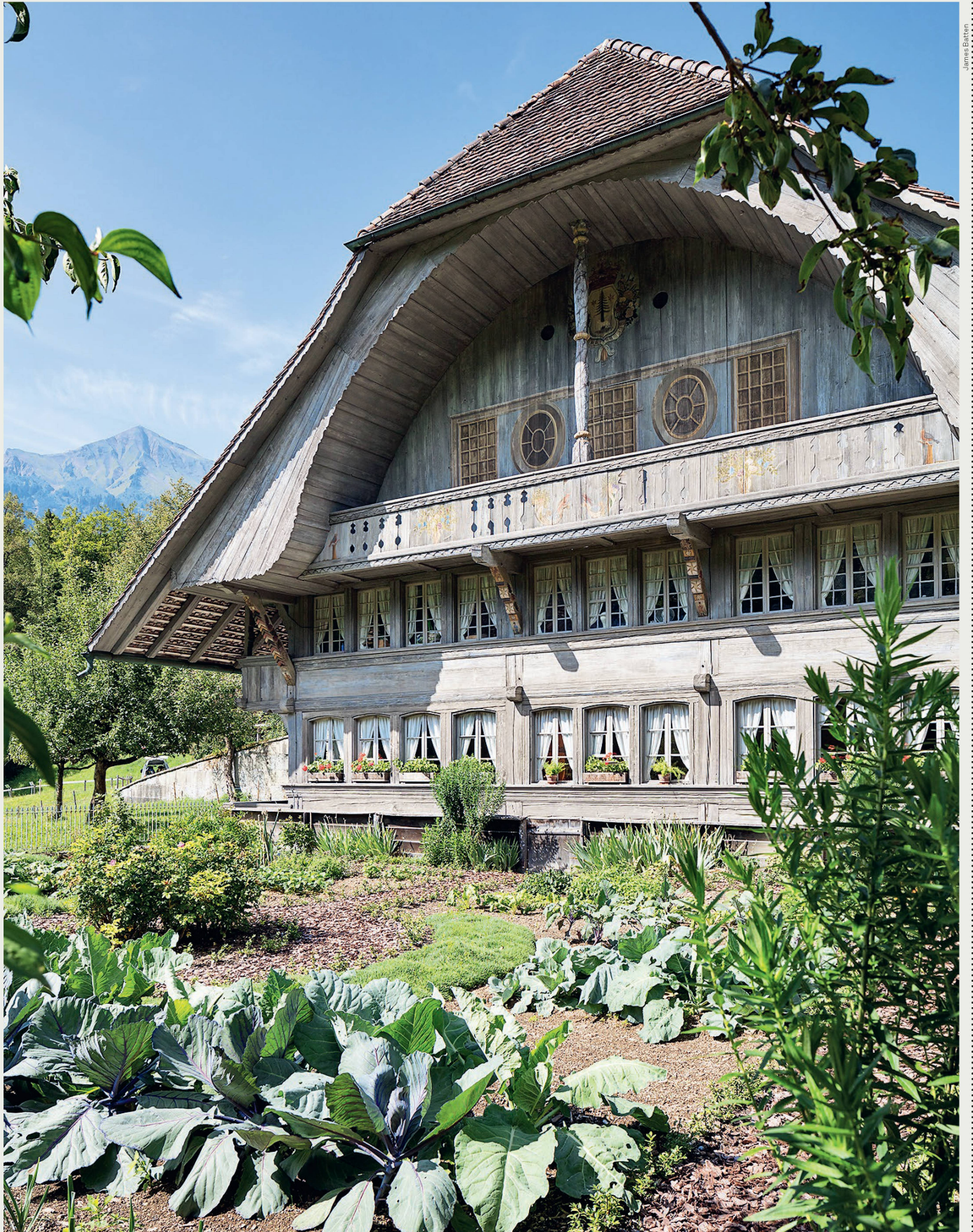
Das Freilichtmuseum Ballenberg engagiert sich seit seiner Gründung für die sorgfältige Pflege und die aktive Vermittlung der traditionellen Garten- und Landschaftskultur. Der Schweizer Heimatschutz würdigte das langjährige Engagement für dieses bedeutende Schweizer Kulturerbe 2018 mit dem Schulthess Gartenpreis.