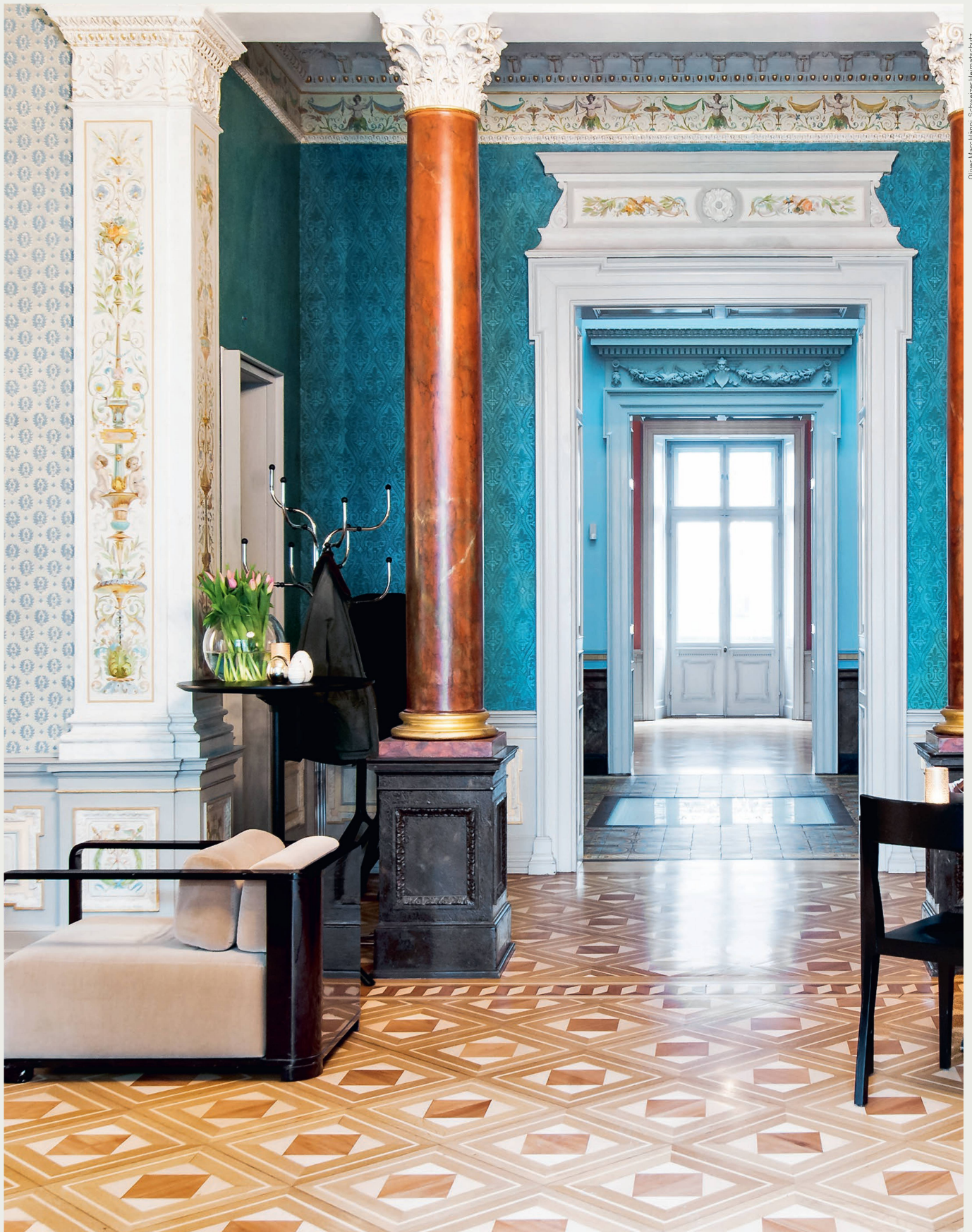
Oliver Marc Hänni, Schweizer Heimatschutz

Der Schweizer Heimatschutz stellt in seiner 2018 erschienenen Neuauflage der Publikation Die schönsten Cafés und Tea Rooms der Schweiz 50 besuchenswerte Lokale in allen Landesregionen vor, darunter das Museumscafé im Bündner Kunstmuseum, Chur.