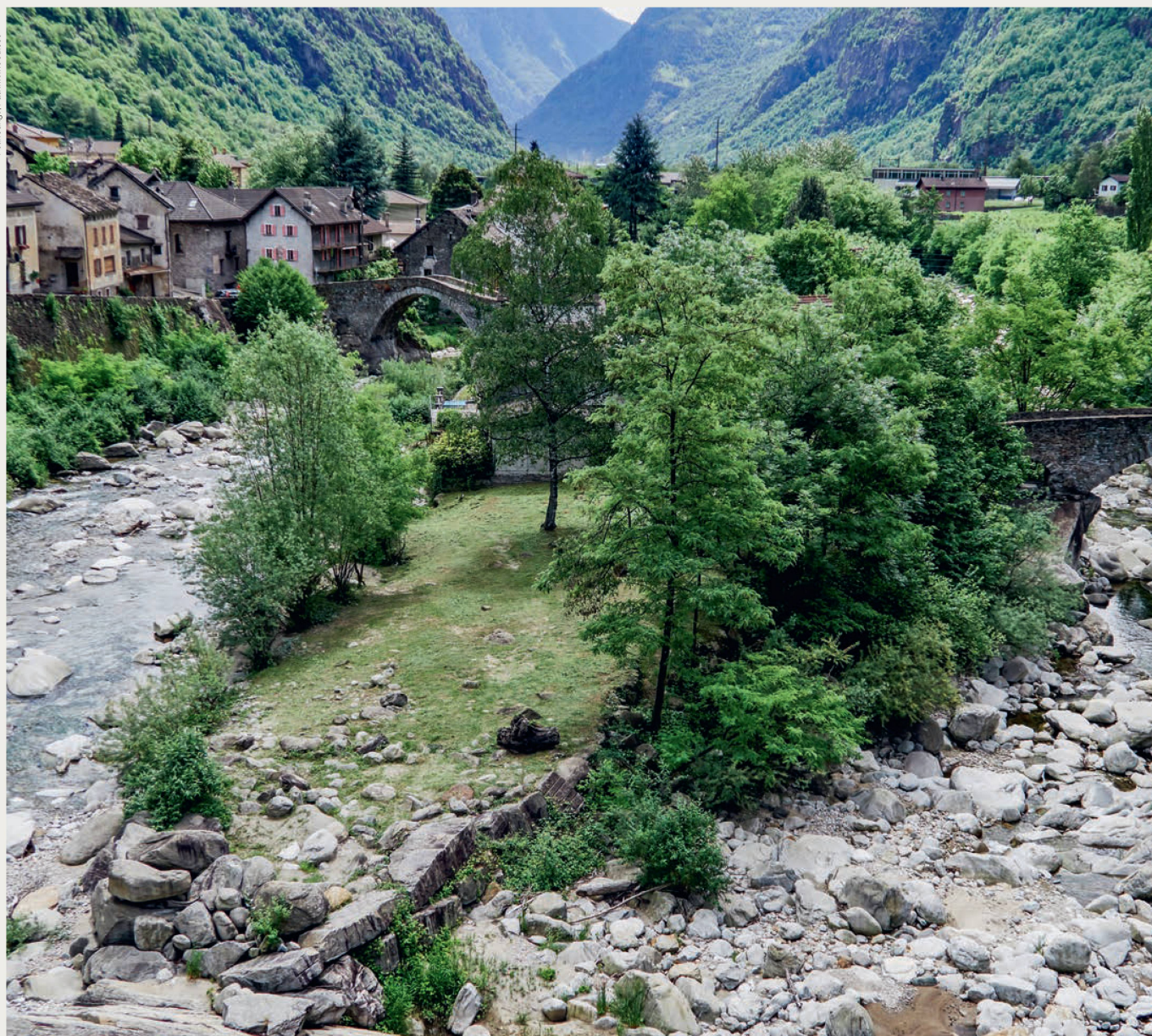
La publication Les plus belles îles de Suisse présente 34 exemples d'îles, notamment l'Isola di Giorno (TI) sur le Tessin.

moine suisse. De par leur statut d'entité juridique distincte, les sections définissent leurs objectifs régionaux et cantonaux, développent leurs propres projets et disposent de voies de recours. Dans le cadre des campagnes de l'Ecu d'or, elles réalisent tous les deux ans des projets en collaboration avec Patrimoine suisse. Durant l'exercice 2017, elles ont préparé pour la célébration de l'Année du patrimoine culturel 2018 un vaste programme proposant plus de 80 manifestations. Les sections organisent les événements in situ. Patrimoine suisse les cofinance par des