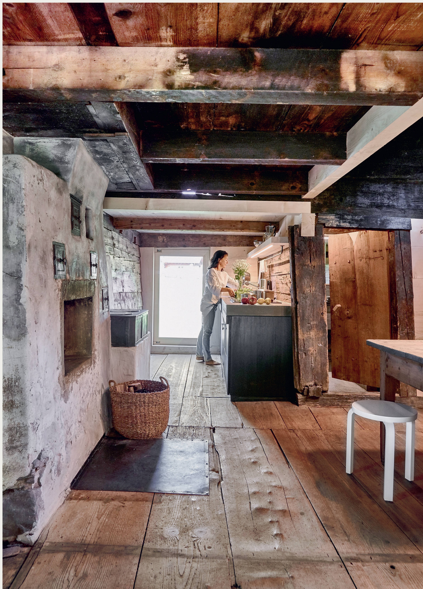
La fondation Vacances au cœur du patrimoine créée par Patrimoine suisse propose depuis 2017 la location de la maison Tannen à Morschach (SZ).