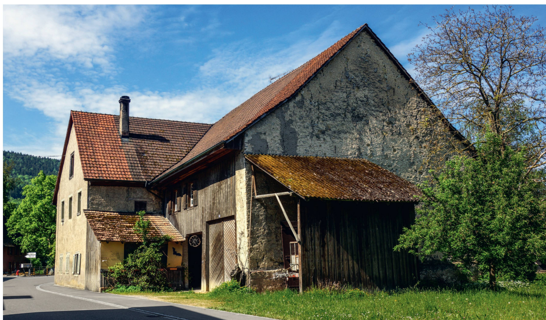
Pro Natura Aargau

Das 1803 als Taverne erbaute Haus in Wegenstetten AG wird in den nächsten Monaten zum «Flederhaus».