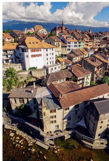
Patrimoine au fil de l'eau