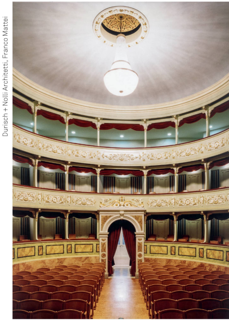
Durisch + Nelli Architekti, Franco Mattei