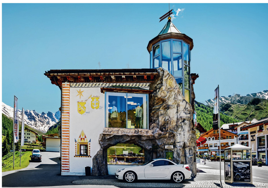
A gauche: Samnaun (GR) autrement. A droite: la villa Tharsilla et l'église de l'Institut des Sœurs de Sainte-Croix de Menzingen (ZG)