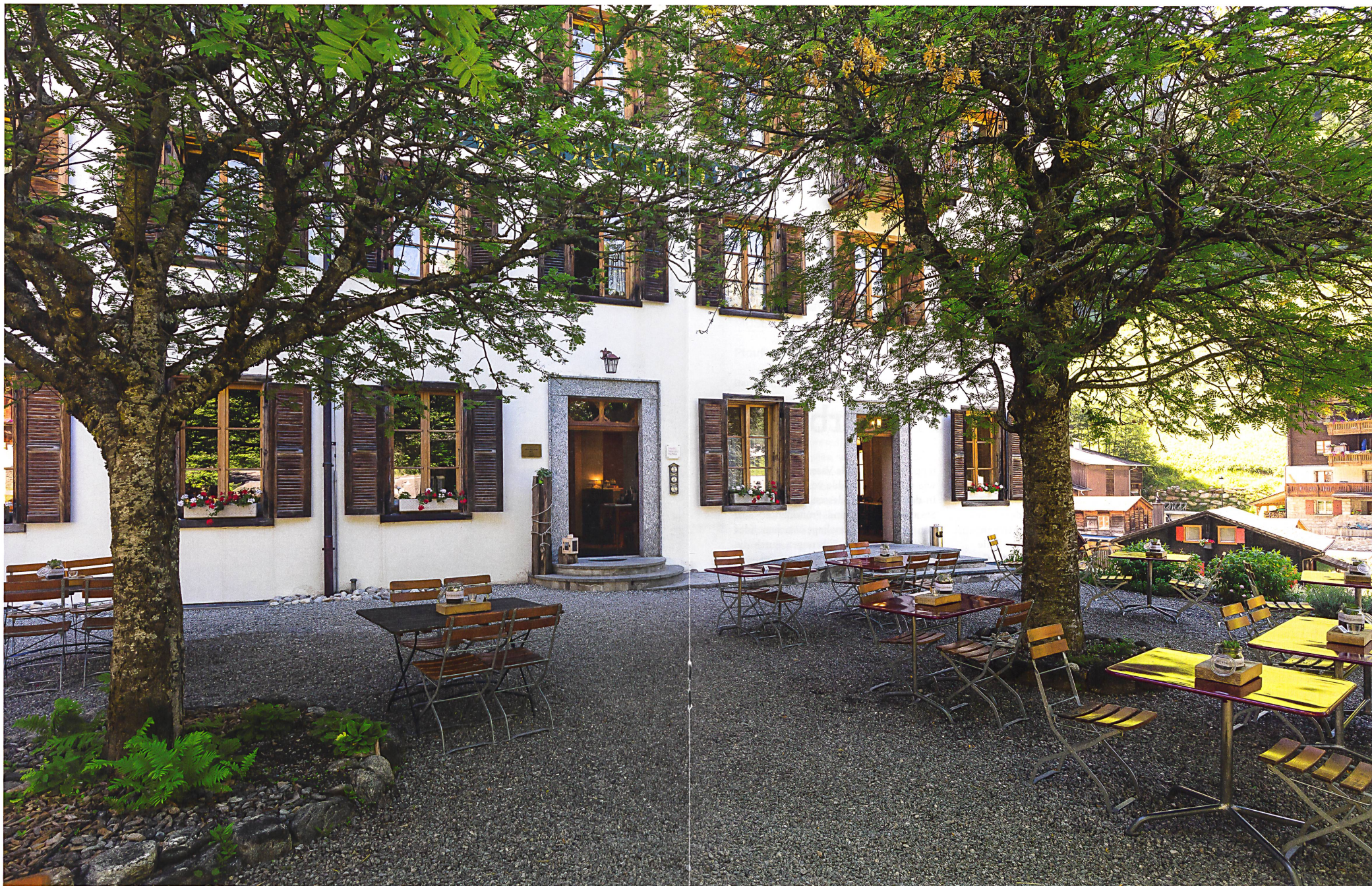
L'hôtel Ofenhorn à Binn: ambiance matinale sous le sorbier de la terrasse-jardin Hotel Ofenhorn in Binn: Vormittagsstimmung unter den Ebereschen des Gastgartens