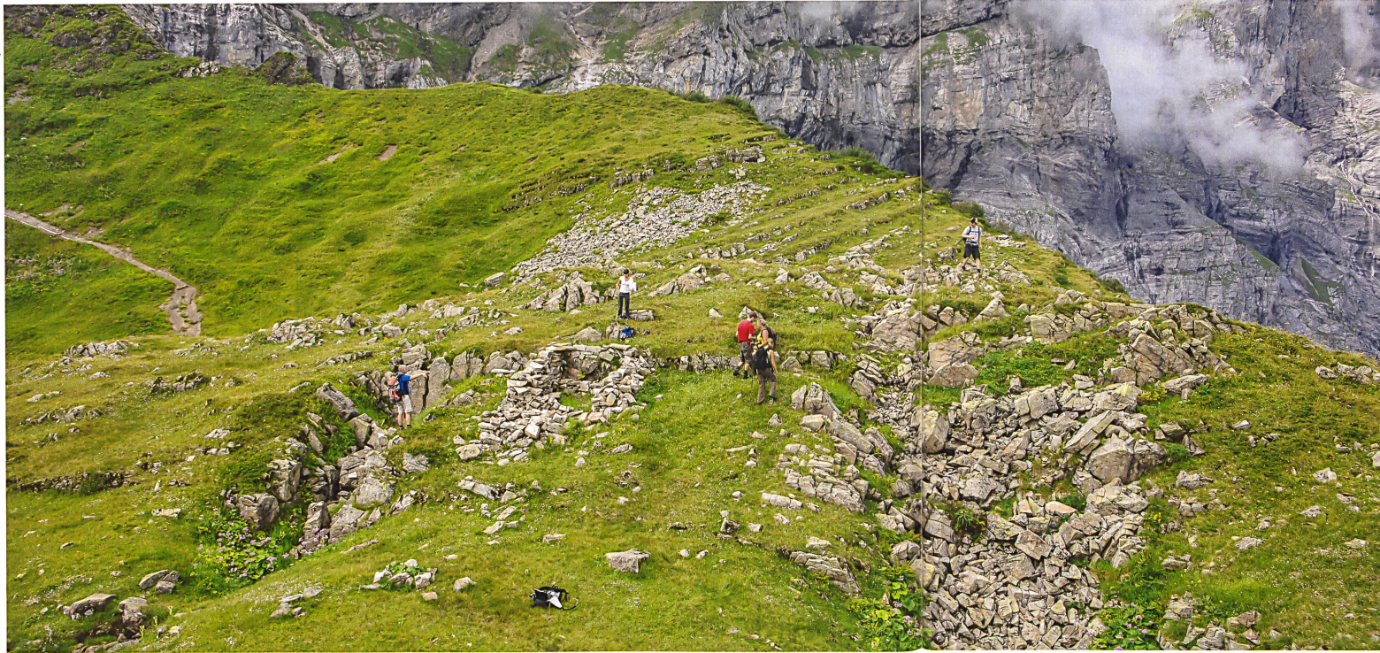
Einer von über 20 ehemaligen Alpbetrieben am Surenenpassweg. Die kleine Hütte auf Attinghausen-Geissrüggen (1954 mü.M.) umfasste zwei Räume.

L'un des 20 anciens alpages recensés au col de Surenen. Cet alpage situé à Attinghausen-Geissrüggen (1954 m) comportait deux pièces.