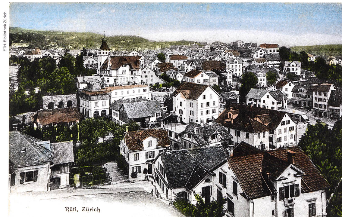
Postkarte von Rüti ZH, vor 1922

Es entbehrt nicht einer gewissen Ironie, dass aktuell starke politische Kräfte das ISOS und den Natur- und Heimatschutz als Ganzes zurückbinden oder gleich abschaffen wollen. Es scheint fast so, als ob das Feld leer geräumt werden müsse, damit sich die Schweiz, die nicht mehr nach aussen wachsen soll, nun nach innen zersiedeln kann. Dass bei diesem politischen Spiel auch nationale und kantonale Planungämter mitmachen, ist mit einer gewissen Erschütterung festzustellen. Sie stehen in der Verantwortung, nicht nur Quantität zu forcieren, sondern für Qualität zu sorgen. So wie es aktuell aussieht, haben einige Ämter und Politiker vergessen, dass man aus der Geschichte auch lernen kann.