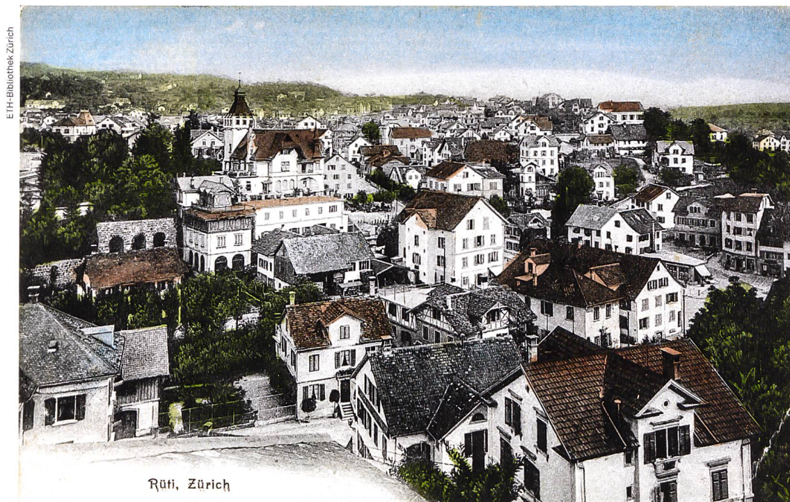
Postkarte von Rüti ZH, vor 1922

Es entbehrt nicht einer gewissen Ironie, dass aktuell starke politische Kräfte das ISOS und den Natur- und Heimatschutz als Ganzes zurückbinden oder gleich abschaffen wollen. Es scheint fast so, als ob das Feld leer geräumt werden müsse, damit sich die Schweiz, die nicht mehr nach aussen wachsen soll, nun nach innen zersiedeln kann. Dass bei diesem politischen Spiel auch nationale und kantonale Planungsämter mitmachen, ist mit einer gewissen Erschütterung festzustellen. Sie stehen in der Verantwortung, nicht nur Quantität zu forcieren, sondern für Qualität zu sorgen. So wie es aktuell aussieht, haben einige Ämter und Politiker vergessen, dass man aus der Geschichte auch lernen kann.