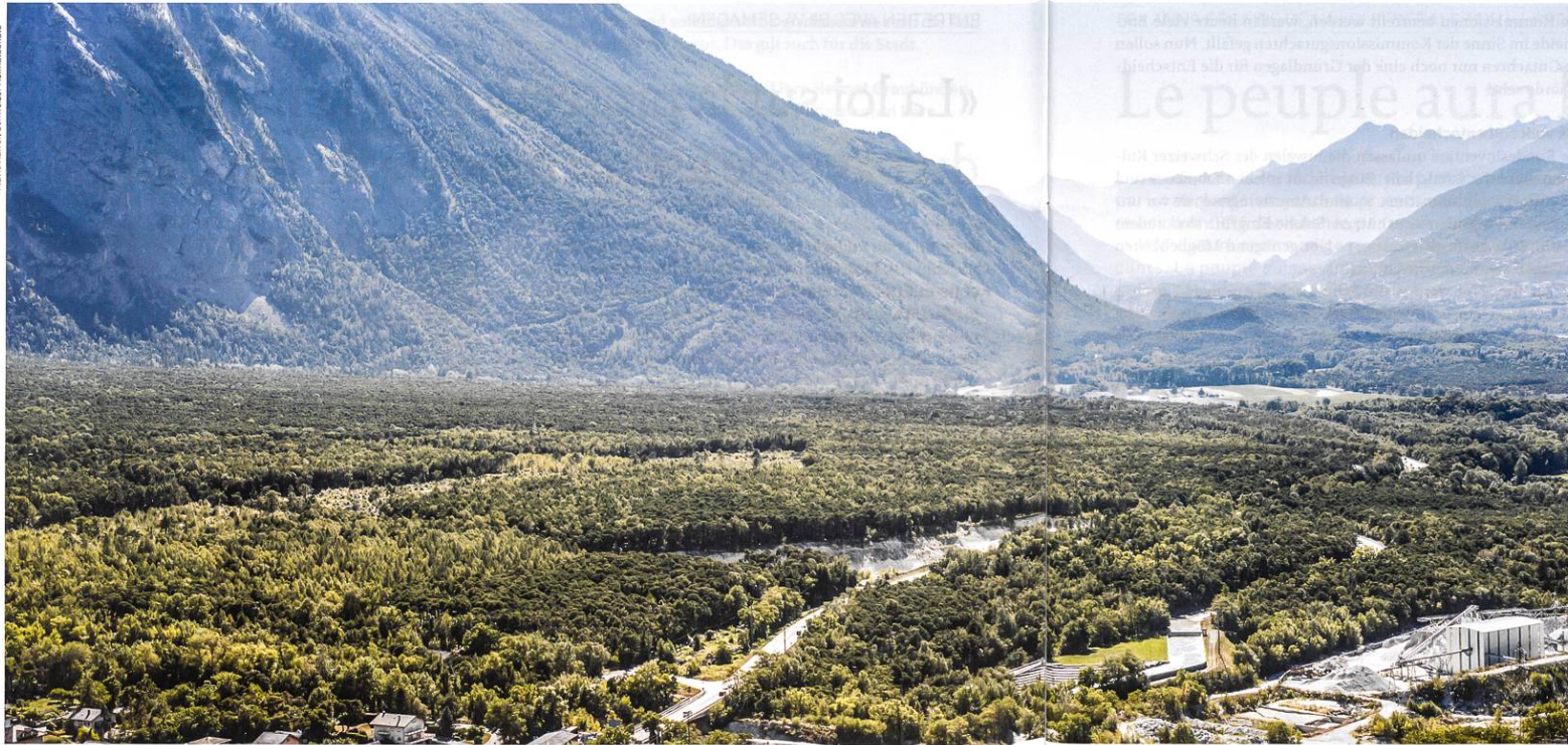
BLN-Gebiet Nr. 1716, Pfywald – Illgraben im Kanton Valais: «Einzigartige Landschaft mit vielfältigen und eindrucklichen Formen.»