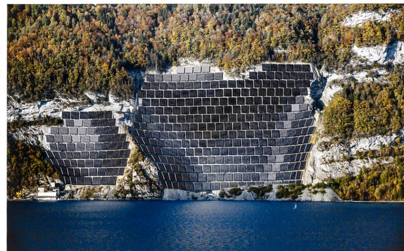
Fotomontage des geplanten Solar-Grosskraftwerks der Elektrizitätswerke des Kantons Zürich (EKZ) und der St.-Gallisch-Appenzellischen Kraftwerke (SAK) am Walensee, mitten im BLN-Gebiet