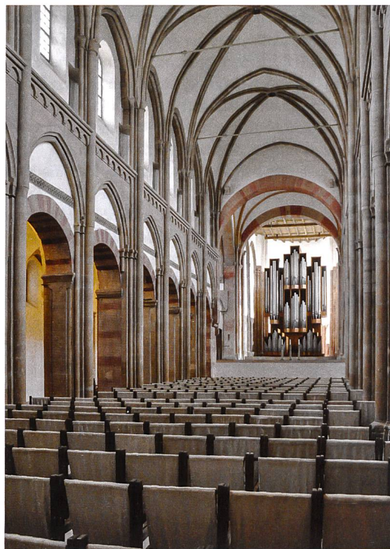
Magdeburg (D): Die Klosterkirche Unser Lieben Frauen wird heute als Konzerthalle genutzt.

Magdeburg (D): l'église Unser Lieben Frauen reconverte en salle de concert.