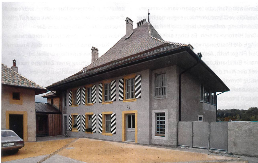
Service des bâtiments, Cure de Gingins, n° 39, 1991