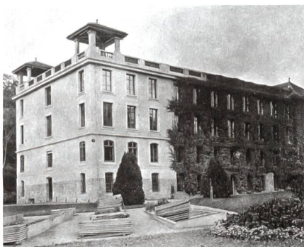
1 La Console entourée de pousses de vigne vierge et la maison du jardinier, en 1905 Das Gebäude «La Console» mit den jungen Rebtrieben und das Gärtnerhaus, 1905