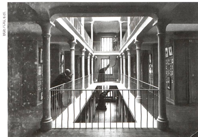
L'atrium, avec les escaliers superposés, suspendus et balancés à retour complet, vers 1904

Das Atrium mit den beiden freitragenden halbgewendelten Treppen, um 1904