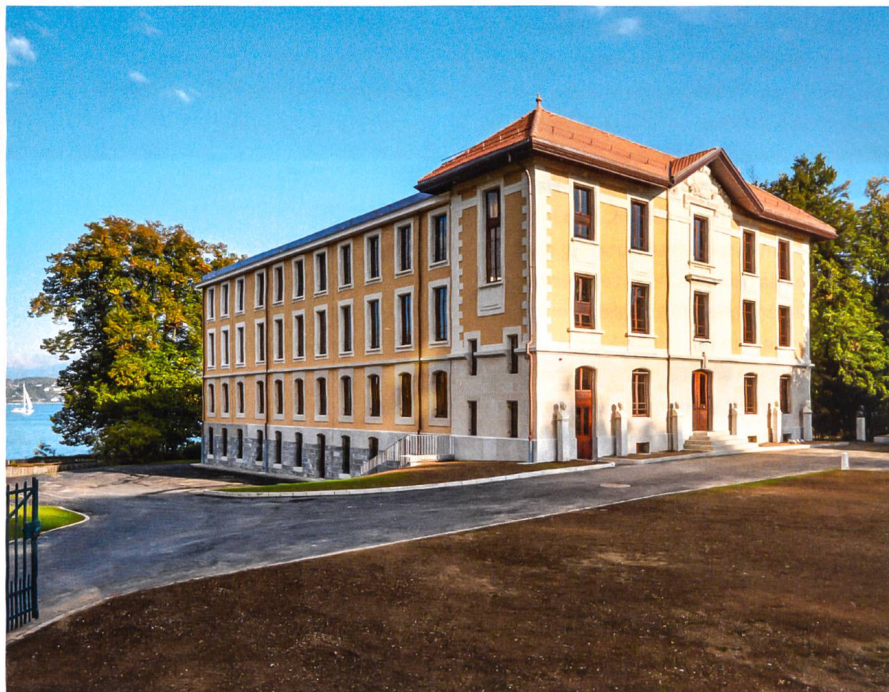
2 Après les deux extensions, encore dépourvues de vigne vierge, et le déplacement des belvédères, en 1924

Das Gebäude nach zwei Erweiterungen, hier noch ohne Reben und mit verschobenen Aussichtstürmen, 1924