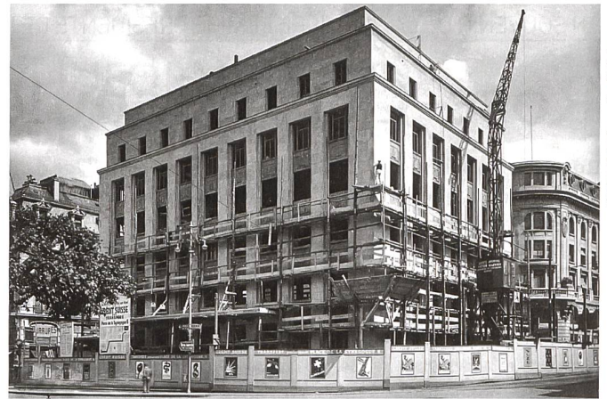
Les façades sur la place Bel-Air et la Corraterie le 2 juin 1931 Fassaden zur place Bel-Air und zur rue de la Corraterie, 2. Juni 1931

est également remodelé. Vingt ans plus tard, la banque subit une nouvelle transformation qui parachève le massacre. Le peu de substance d'origine disparaît alors: fenêtres, marquises, intérieurs... Ces deux interventions qui procèdent par superposition de nouvelles strates font perdre à l'édifice tout relief.