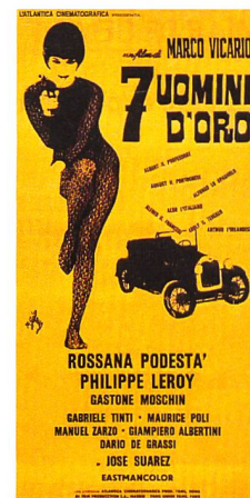
L'affiche de Sette uomini d'oro

alors soulignés de profils dorés et les contrecœurs revêtus de marbres polis. L'attique est également altérée. Les façades du 5 e en léger retrait sont avancées au même nu que celles des étages courants et surmontées d'une corniche plate. Les ferronneries et les luminaires du rez-de-chaussée – de qualité mais dont le dessin Art déco révèle l'âge – sont enlevés. L'intérieur