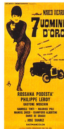
L'affiche de Sette uomini d'oro Filmplakat: Sette uomini d'oro

alors soulignés de profils dorés et les contrecœurs revêtus de marbres polis. L'attique est également altéré. Les façades du 5 e en léger retrait sont avancées au même nu que celles des étages courants et surmontées d'une corniche plate. Les ferronneries et les luminaires du rez-de-chaussée – de qualité mais dont le dessin Art déco révèle l'âge – sont enlevés. L'intérieur