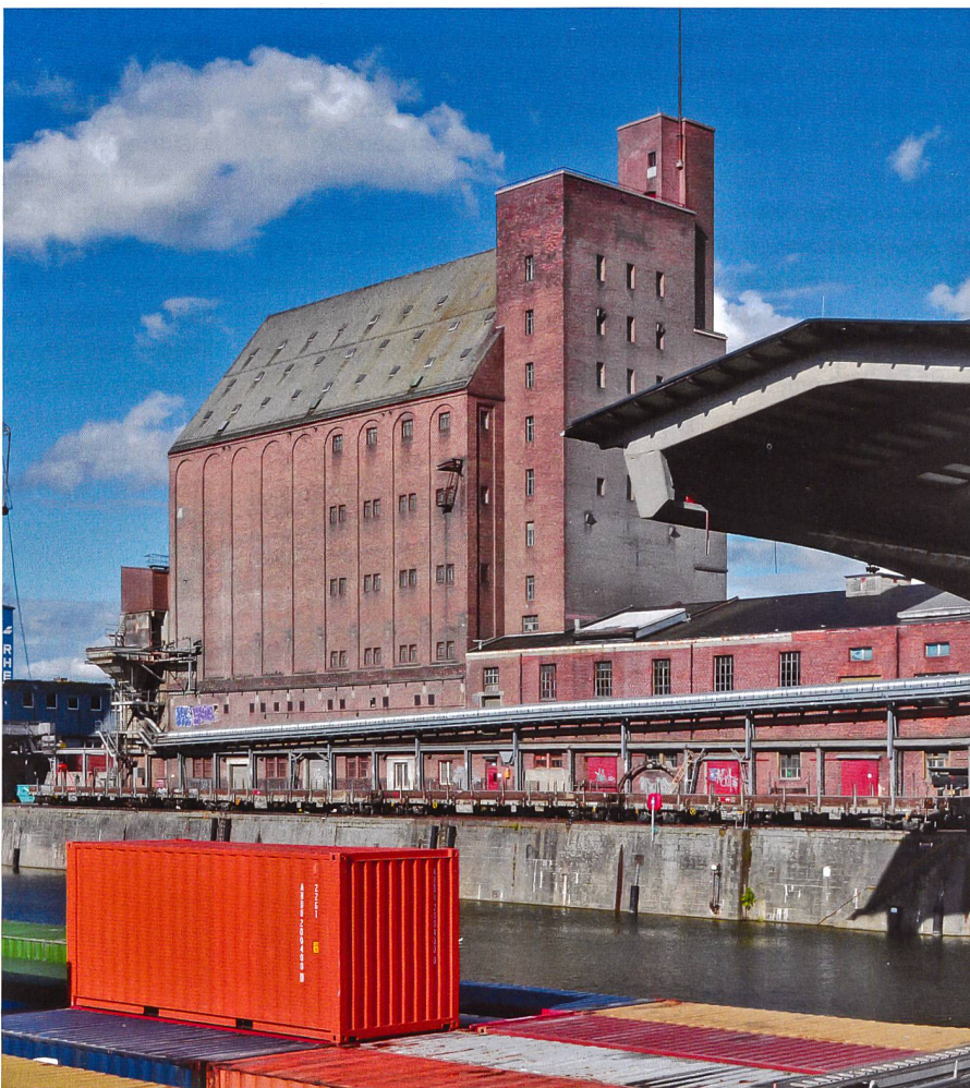
Kantonale Denkmalpflege Basel-Stadt

→ info@nike-kulturerbe.ch oder www.hereinspaziert.ch