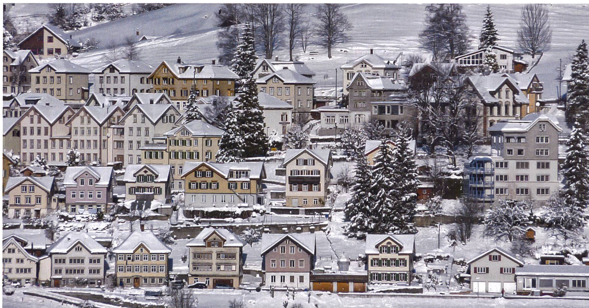
Heimatschutz Appenzell Ausserrhoden

Une suppression de la zone de protection dans la commune de Rehetobel mettrait en péril l'harmonie des constructions.