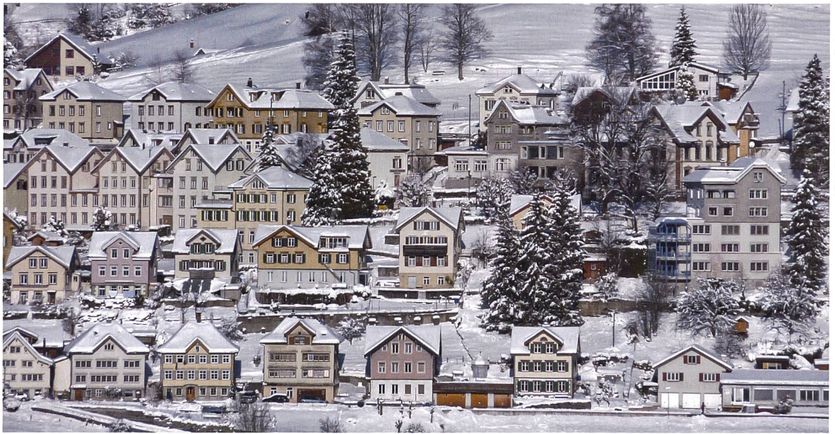
Heimatschutz Appenzell Ausserrhoden

Une suppression de la zone de protection dans la commune de Rehetobel mettrait en péril l'harmonie des constructions.