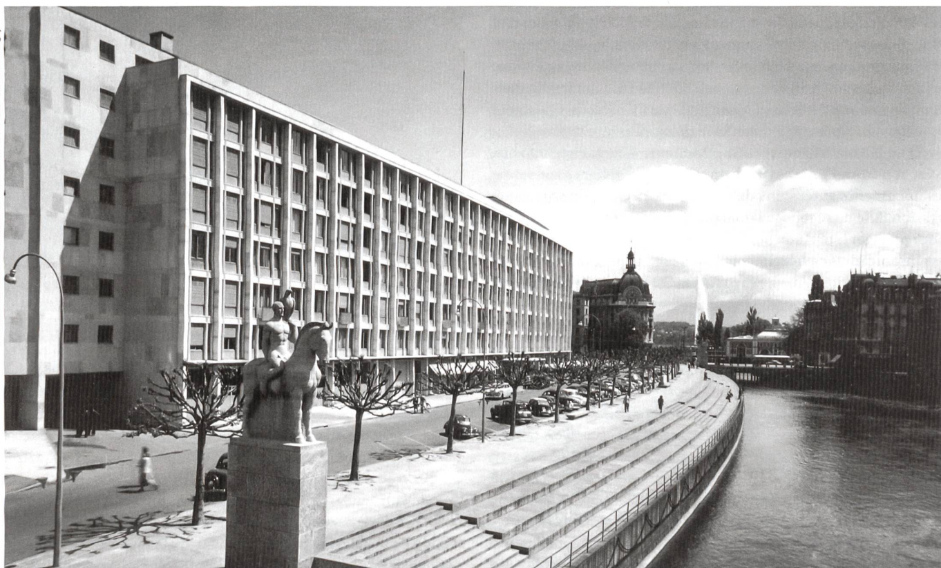
A. Mandanis, Archives d'architecture de l'Université de Genève, Fonds Saughey

Le succès ne se fait pas attendre. En ce début des années 1950, l'hôtel est le lieu où il faut se montrer et être vu. Pas une manifestation ne se déroule alors à Genève sans un apéritif, déjeuner ou