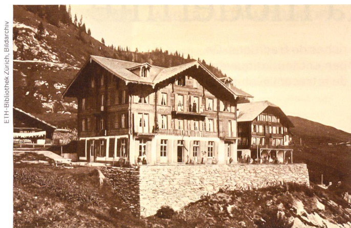
Die Hotels Silberhorn (rechts, 1858 eröffnet) und Mürren (links, 1871 hinzugefügt, mit Querfirst von 1876)