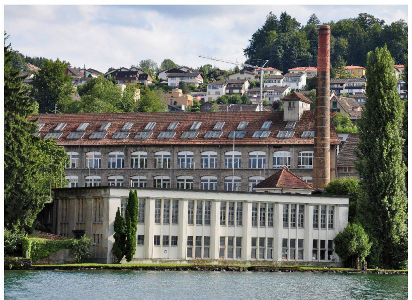
Das Industrieensemble auf der Halbinsel Giessen bei Wädenswil