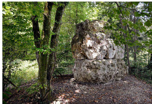
Le Zellweger-Park d'Uster et le «Cube» de Sol LeWitt, le «Moosfelsen» de Fischli/Weiss et la «Drift Structure» de Tadashi Kawamata (à droite, de haut en bas)