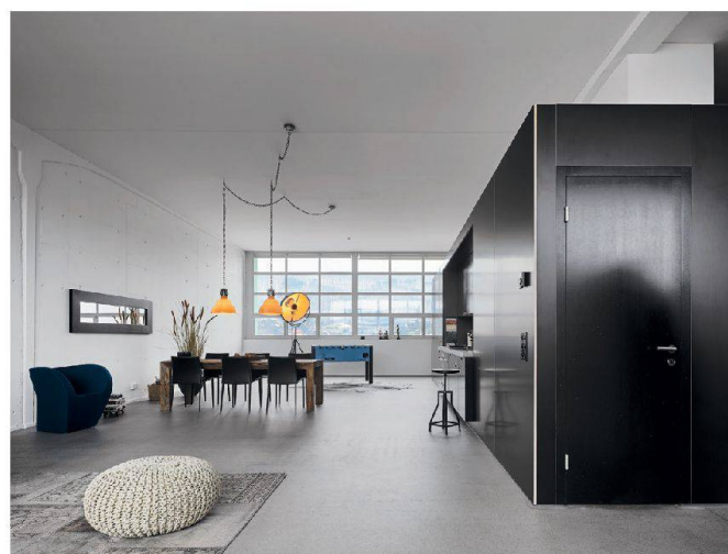
Die kastanienbraunen oder schwarzen «Wohnmöbel» in den Lofts lassen viel Luft zur vier Meter hohen Decke.