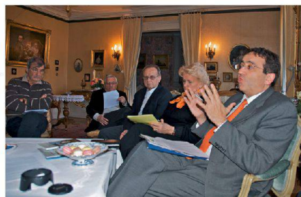
Patrimoine suisse, section VD