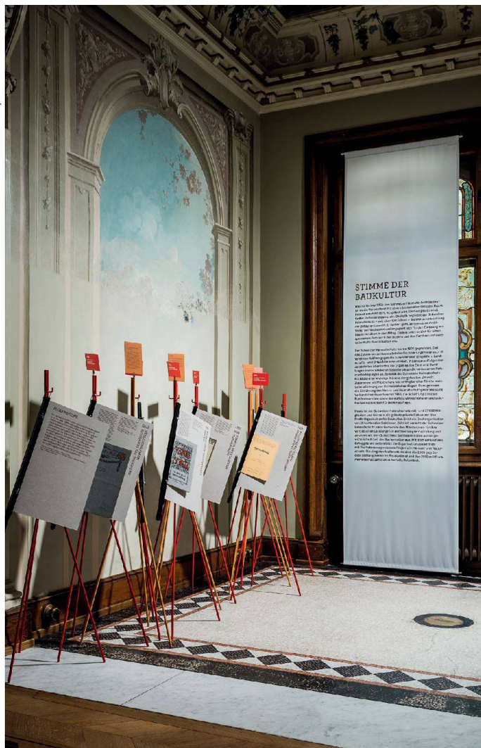
Le module: «la voix du patrimoine bâti», installé dans le jardin d'hiver Der Ausstellungsbereich «Stimme der Baukultur» im Wintergarten

La mise en scène des films, des photos et des objets est étudiée pour créer trois installations différentes et surprenantes qui – de même que les trois salles d'exposition – évoquent trois ambiances différentes.