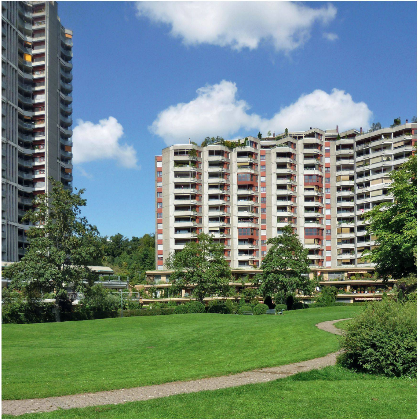
Die 1984 eingeweihte Siedlung Holenacker in Bern (Reinhard & Partner, Lutstorf & Hans, U. Strasser, Helfer Architekten AG, Ehrenberg-Kernen-Schwab)

stark unter Druck glaubten und zu retten suchten, was noch zu retten war. Der Leser gewinnt den Eindruck, dass womöglich sogar sie selber an der Wohnqualität der Hochhäuser zweifelten.