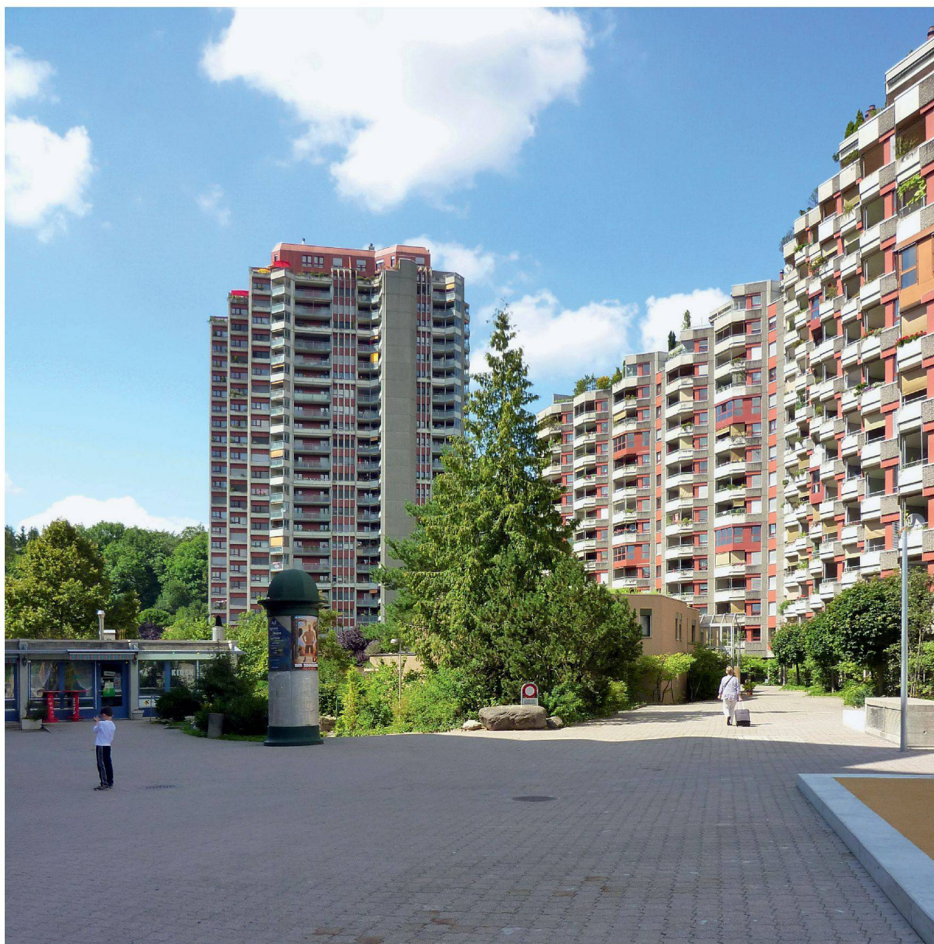
Le quartier Holenacker de Berne inauguré en 1984 (Reinhard & Partner, Lutstorf & Hans, U. Strasser, Helfer Architekten AG, Ehrenberg-Kernen-Schwab)

ter, als hinter den Demonstranten lauter ewig gestrige Kommunisten zu sehen, die sich die DDR zurückwünschen. Vielmehr wollten diese darauf aufmerksam machen, dass die Mauer ein wichtiges historisches Dokument sei, das unabhängig von historischen Einschätzungen der DDR erhalten bleiben müsse. Ein denkmalpflegerisches Schutzinventar ist also nicht als die späte Benotung von Architekturwerken zu verstehen, sondern als eine in der Zeit der Inventarisierung vorgenommene Interpretation von Gebäuden auf ihren Aussage- und Bedeutungsgehalt. So verstanden ist eine Unterschutzstellung eines einst bekämpften Ge-